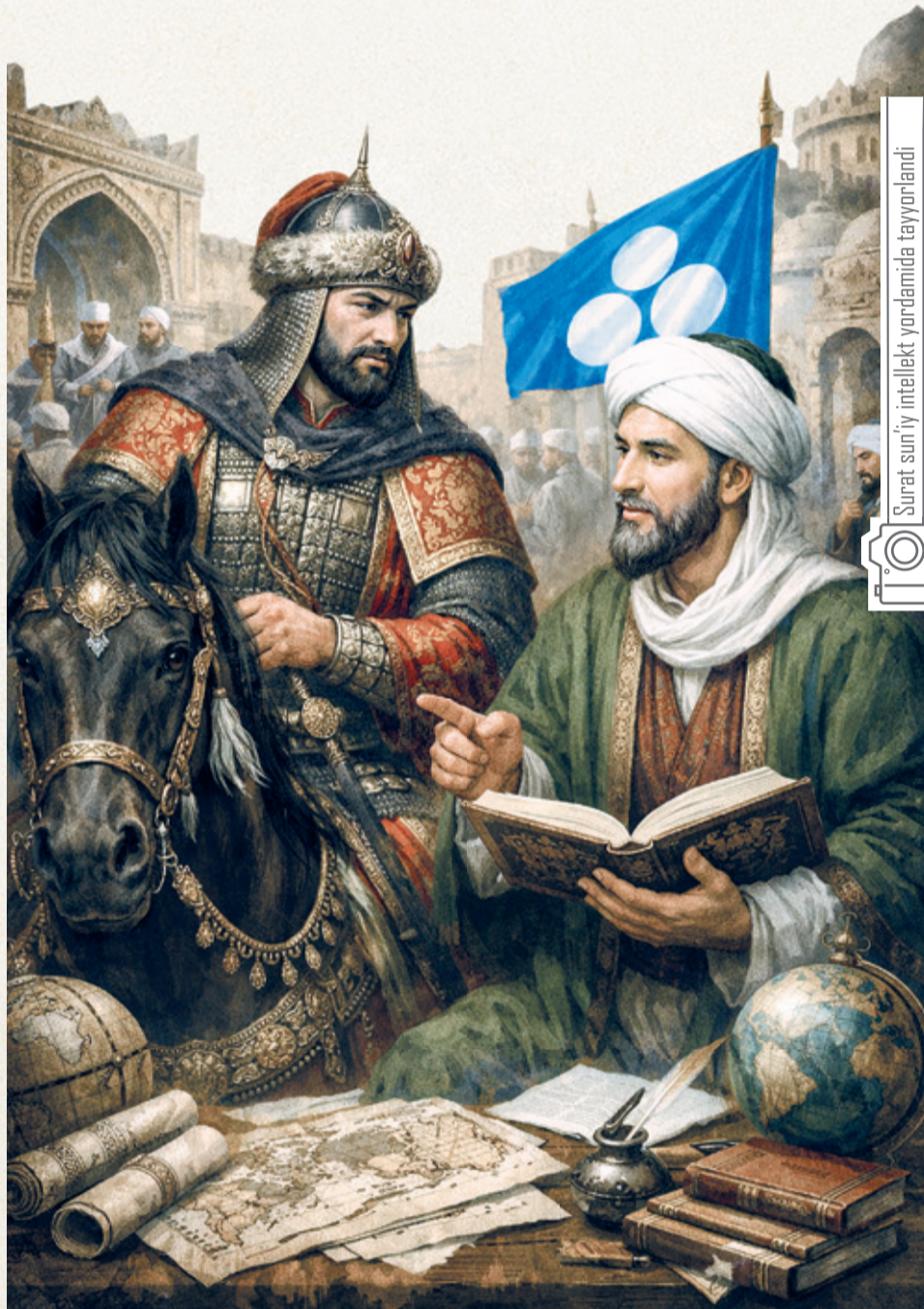
Surat sun'iy intellekt yordamida tayyorlandi

Ibn Arabshoh ta'kidlashicha, u Amir Temur huzurida nafaqat imom, balki ilm ahli vakili sifatida ham tanilgan, faqihlikda chuqur bilimga ega fozil olim edi. Shu bois Amir Temurning saroyida o'tkaziladigan ilmiy majlislarda ko'pincha hakamlik qilgan. Ayniqsa, o'sha davrning yirik allomalari Sa'duddin Taftazoniy va Sayyid Sharif Jurjoniy o'rtasidagi mashhur bahsda hakamlik qilgani alohida eslanadi. Manbalarda aytilishicha, bu munozarada Sayyid Sharif Jurjoniy g'olib