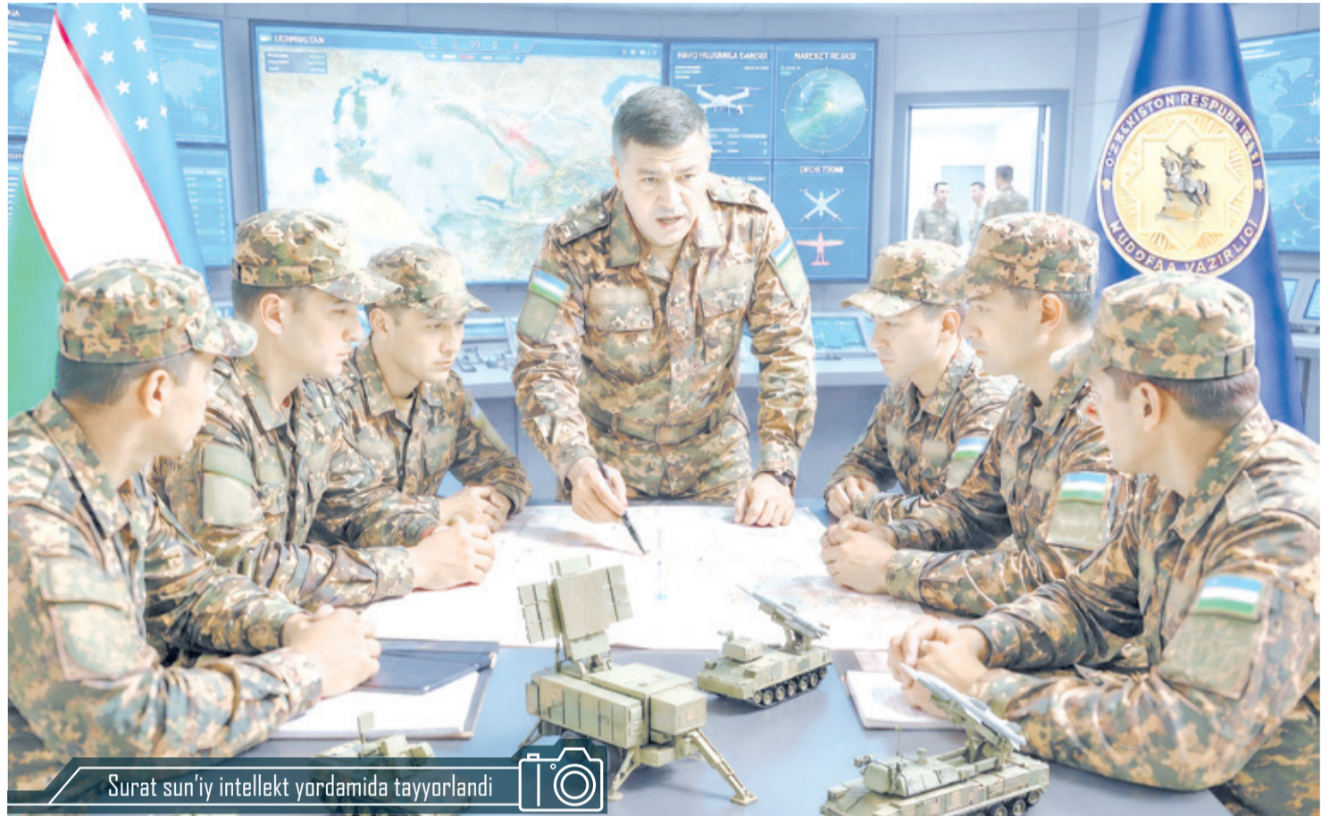
Surat sun'iy intellekt yordamida tayyorlandi

Mazkur manbalar asosidagi harbiy boshqaruv faoliyati o'zining tub mohiyatiga ko'ra, ikki yo'nalishli jarayondir. Bir tomondan, u ofitserlar tomonidan yagona maqsad yo'lida tizimli ravishda bajariladigan vazifalar majmuini anglatadi, ikkinchi tomondan – rahbarning tashkilotchilik qobiliyati, uslubiy yechimlari va shaxsiy ( subyektiv ) fazilatlarining o'zaro uyg'unligini namoyon etadi. Harbiy olim P.K. Altuxov o'zining "Qo'shinlarni boshqarish asoslari" nomli fundamental