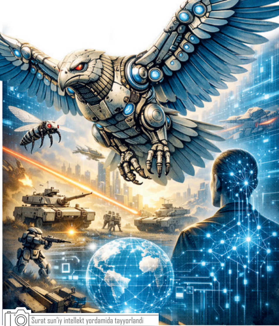
Surat sun'iy intellekt yordamida tayyorlandi

Bionik dronlarning eng katta afzalliklaridan biri, ularning tabiiy muhitga