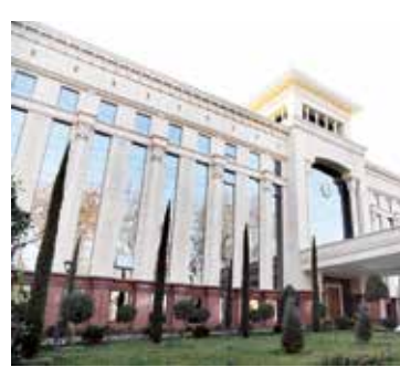
Oliy Majlis Senatining Fan, ta'lim va sog'liqni saqlash masalalari qo'mitasi majlisida qator dolzarb masalalar muhokama qilindi. Dastlab talabalarni turarjoy bilan ta'minlash ishlari holati ko'rib chiqildi.

asosiy qismi ijrada yashashga majbur bo'lmoqda. Davlat-xususiy sheriklik asosida tashkil etilgan ayrim yotoqxonalarda yuvinish xonalari sanitariya-gigiyena talablariga to'liq javob bermaydi.