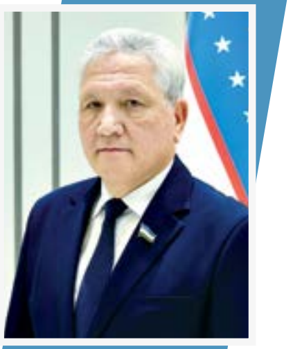
Odiljon MAMATKARIMOV, senator

So'nggi yillarda yangi O'zbekistonda oliy ta'lim sohasini tubdan isloh qilish, qamrovi va sifatini oshirish, zamonaviy mehnat bozori talablariga mos kadrlar tayyorlash masalasi davlat siyosatining ustuvor yo'nalishlaridan biriga aylandi. Bu esa turli tarmoqlar uchun yuqori malakali mutaxassislar tayyorlash imkoniyatini kengaytirmoqda.