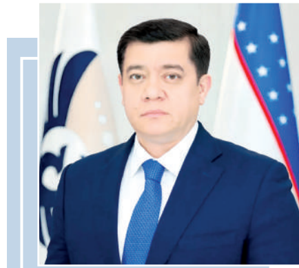
Фаррух ПУЛАТОВ, Ўзбекистон Республикаси Солиқ кўмитаси раиси

Солиқ кўмитаси жамоаси ижро этувчи орган сифатида топшириқларнинг ўз вақтида бажарилиши, мазкур йўналишда мустақам ижро интизомини жорий қилиш борасида тизимли иш юритади.