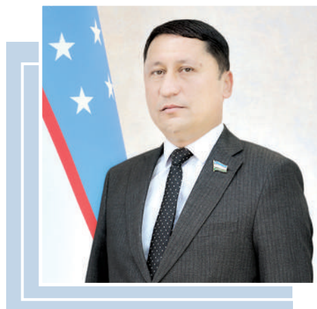
Зухриддин МАВЛОНОВ, Олий Мажлис Қонунчилик палатаси депутати

Шу сабабли қонун билан мансаб ваколатларини суиистеъмол қилиш орқали гиёҳвандлик воситаларининг ноқонуний муомаласига ҳомийлик қилиш, раҳнамоллик қилиш ёки бундай жиноятлар фож бўлишининг олдини олиш мақсадида олдиндан хабар бериш учун ҳам 5 йилдан 20 йилгача озодликдан маҳрум қилиш жазоси белгиланди.