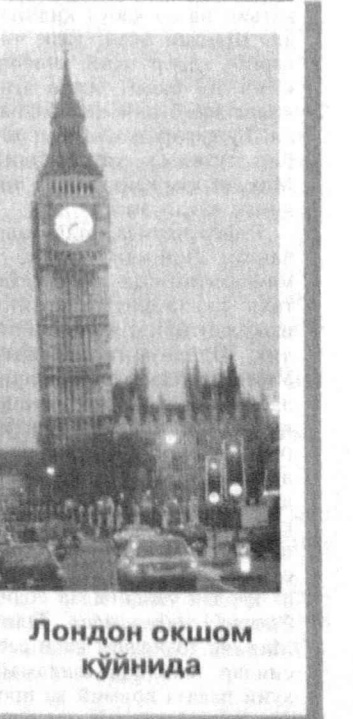
Лондон оқшом кўйинда

АҚШнинг Гуантанамо (Куба)да жойлашган ҳарбий денгиз базасига «Ал-Қоид» ва «Талибон» экстремистик ташкилотларига тегишли террорчилардан иборат асирларнинг учинчи гуруҳи олиб келинди. Америка ҳарбийларининг 600 нафари Филиппинга етиб келди. Улар мамлакат ҳарбийлари «Абу Сайяд» экстремистик гуруҳини йўқ қилишга қўмақлашади. Франциянинг Пью де тарингта илк бор аҳолини менингитга қарши вакцинация қилишга киришди. Хабарларда айтилишича, бу ерда менингит эпидемияси хавфи бор. Чунки сўнгги йилда 18 нафар киши ана шу касал билан оғирган. 4 нафар киши айнан шу касаллик сабабини ҳаётдан кўз юмган.