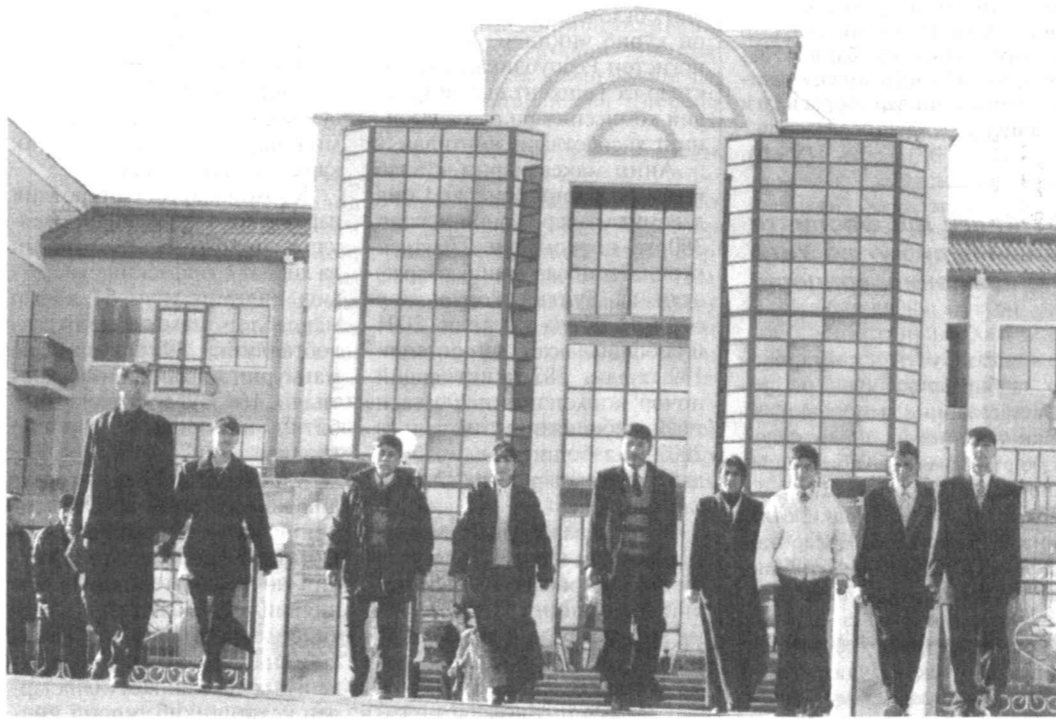
Билим олишлари учун барча шарт-шароит етарли.

Атак-чекач қадам ташлаётган гудакни суяб-эркалаётган ҳар бир ота-она ўз фарзандини келажакда баркамол инсон сифатида кўришни орзу қилади. Ушбу суратларга разм солинг. Бу йигит-қизлар Самарқанд тумани маркази — Гулободда кунги кеча фойдаланишга топширилган Ижтимоий-иктисодий касб-хунара коллежининг талабаларидир. 400 нафар ёшни бағрига олган бу билим масканда нафақат Самарқанддан, балки қўшни Жиззах, Навоий, Қашқадарё ва Бухоро вилоятларидан келган ўғил-қизлар ҳам таълим олишмоқда. Чунки бу ерда уларнинг