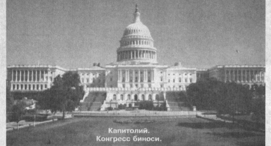
Капитолий. Конгресс биноси.

раиси ҳисобланади. Лекин у овозлар тенг иккига бўлиб қолган ҳоллардан ташқари вазиятларда овоз беришда қатнашмайди. Сенат вице-президент жойида