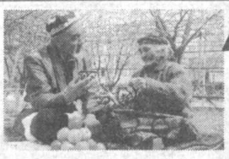
— Сиз билан илгари қўришганимизми? Қўришга иссиқ кўрина-яписиз.

— Бўлиши мумкин. Улар юк машинасида кетишадигани. Каби-нада икки киши рудлагисининг ёши анча катта. Бот-бот ҳамроҳига қараб қўяди. «Шахарлик бўлса керак. Биз томонларга меҳмонга келадиган бўлса, ажабмас, ўйлайди у. Ташқаридан шаррос ёмғир ёғар, юриш анча мушкуллашган эди. Бўзсан халқоб йўллардан, баъзида ўнқир-чўнқир жойлардан ўтаётганда «ЗИЛ» сўлиниб-сўлиниб қўяди. Бундай ҳақиқат қўришининг ўзи бўлмади. Ҳайдовчи ёнида кетаётган кишининг хечрасида ташвиш аломати борлигини пайқайди.