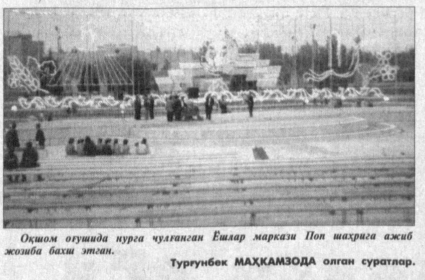
Оқимон отушида нурга чўлганган Ешлар маркази Поп шаҳрига ажиб жойиба бахш этган.