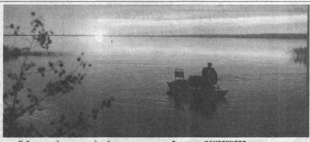
Қуёш оғушида жилоланди қўл...