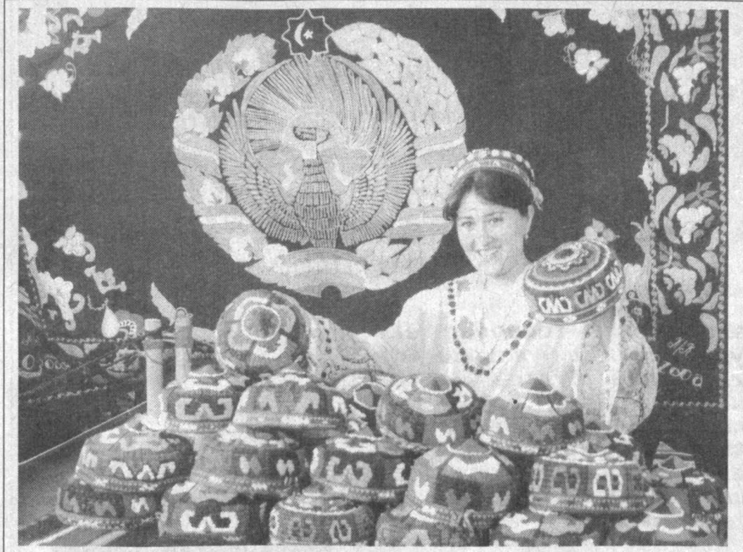
Тўйларга буюрсин, тўйларга...

Қорақалпоғистонлик матлуботчиларнинг бир гуруҳ фарзандлари ёғи таътилнинг ушбу ойини Нукус яқинидаги сўли «Аччиққўл» бағрида жойлашган «Юлдузча» оромгоҳида ўтказадиган бўлиши. — Фарзандларимизнинг кўнгилли дам олишлари учун барча шароитни муҳайё қилдик, — дейди «Қорақалпоғистон» акциядорлик компанияси бошқаруви раиси, Қорақалпоғистон Жўқорги Кенгеси депутаты Ҳамид Файзуллаев. — Келажгимиз эгаларидан ҳеч нарсани аймаймиз. «Халқ сўзи» — «Туркистон-Пресс».