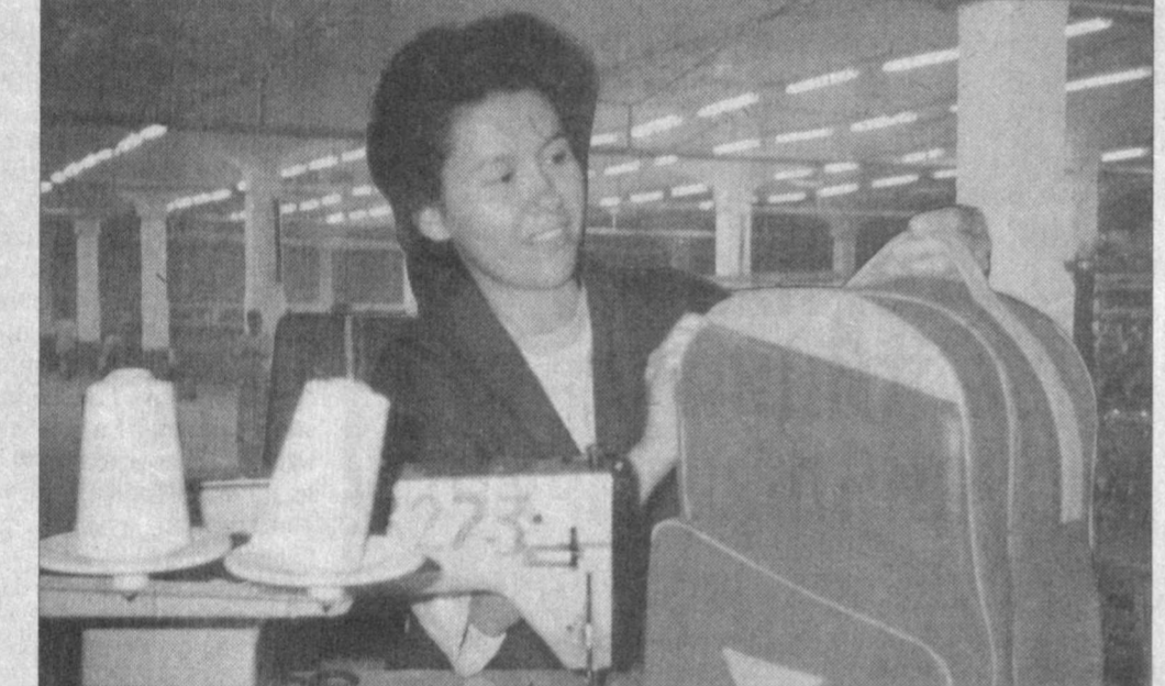
Фаргона шаҳридаги «Суний чарм» ҳиссадорлик жамияти суний чарм, пойабзал учун картон ва фильмограф картон, нотўқима матолар, ўқувчилар сўмчаси ишлаб чиқаришда иштирок этаётган. Ҳар йили беллавланган режалар ортиси билан уюлланиб келинмоқда. Олинган фойда миқдори ҳам охиб борапти. Жамият маҳсулотлари шартнома асосида Ҳамбургдаги маъмурият ва Туркияда жамиятнинг. Жорий йилда уларнинг миқдори икки бараварга кўпайтириш мўлжалланмоқда.

Маълумки, «Экосан» халқаро хайрия жамараси қўшни Афғонистонда «Экосан» миссиясини ташкил этган эди. Миссия аъзолари Афғонистон ташқи ишлар вазирлиғи ваколатхонасида Балх вилояти раҳбарияти, давлат ва нодавлат ташкилотларининг раислари, БМТ институтлари, халқаро инсонпарварлик ташкилотлари раҳбарлари, Балх университети раҳбарияти ва профессор-ўқитувчилари билан учрашувлар ўтказишди.