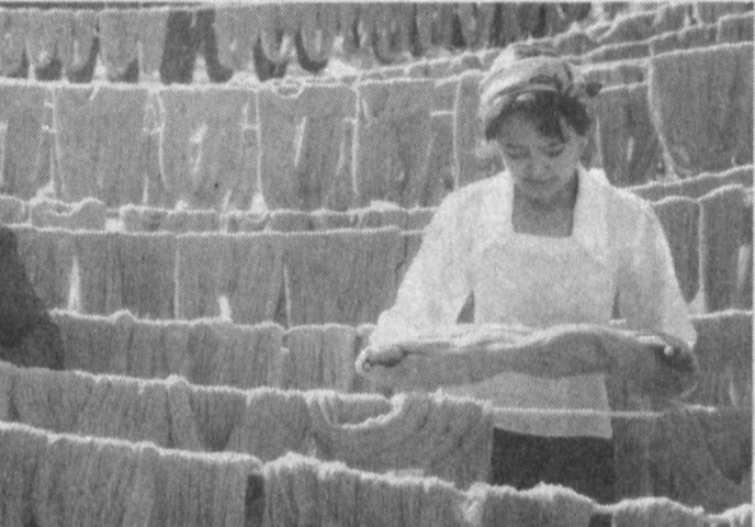
Кейинги пайтда Уйчи туманида кичик ва ўрта тадбиркорликни ривожлантиришга алоҳида эътибор бериляпти. Мазкур йўналишда иш юритаётганларга етарли даражада шарт-шароит яратилаётганлиги боис уларнинг сонин ҳам, ишлаб чиқарилаётган маҳсулотлар ҳамини ҳам ошириб бормоқда. Айтиш пайтда ушбу соҳада 13359 тадбиркор иш юрляпти. «Муш-тарий-А-И-ЛТД» ҳуусейн корпорациясининг фаолияти, айниқса,

Иқтисодини мунтазам ва изчил юксатириш боришга эришиш — «катта саккизлик»ка аъзо мамлакатларнинг бош мақсади. Шу билан ҳам иқтисодий масала ҳар бир саммитда асосий мавзу си-