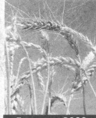
«Галла — 2002»