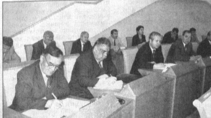
СУРАТЛАРДА: йиғилиш пайтидан лавҳалар.