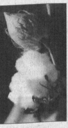
Муналари олиб келинди. Уларнинг ўзига хос хусусиятлари ўрганилиб, икким шароитимизга мос жиҳатлари аниқланмоқда.

Нав яратиш жараёнининг дастлабки босқичларидан бошлаб тола сифатини аниқлаш имконини берувчи замонавий лабораториянинг ишга тушиши фаолиятимиз ривожига муҳим аҳамият касб этди, — деди мазкур институти директорининг илмий ишлар бўйича ўринбосари Шоолмон Номозов ЎзА муҳбирига. — Натўжда авмухбирга, — Натўжда авмуналарига нисбатан имкон туғилди. Кейинги йилларда хоржий мамлакатлардан беш мингдан зиёд нав на-