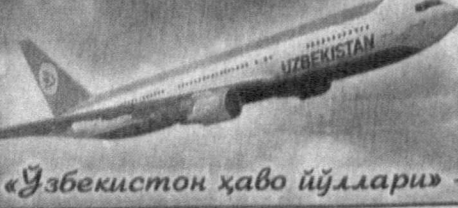
«Ўзбекистон ҳаво йўллари» — хавфсизлик, барқарорлик, қўлайлик.

Авиачипталарни Ҳаво алоқалари бош бошқармаси ва унинг барча филиаллари кассаларида харид қилиш мумкин. Маълумот учун телефон: 066.