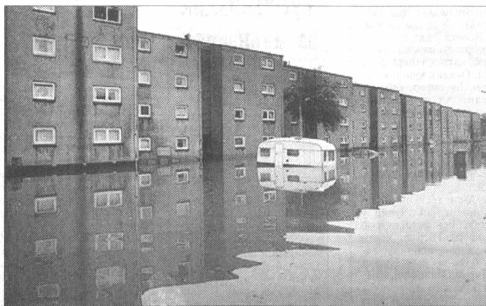
Тошқинлардан четда қолмаган Буюк Британиянинг Глазго шаҳри бугун Венецияни эслатади...