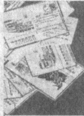
Яқинда янги "Семурғ" халқаро жамғармаси тузилганлиги хақида эшитиб қолдим. У қандай жамғарма, қайси қумушлар билан шуғулланади?