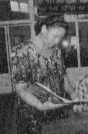
— СУРАТЛАРДА: Республика товар-хомашё биржаси Жиззах филиали бизнес; электрон ахборот марказида.