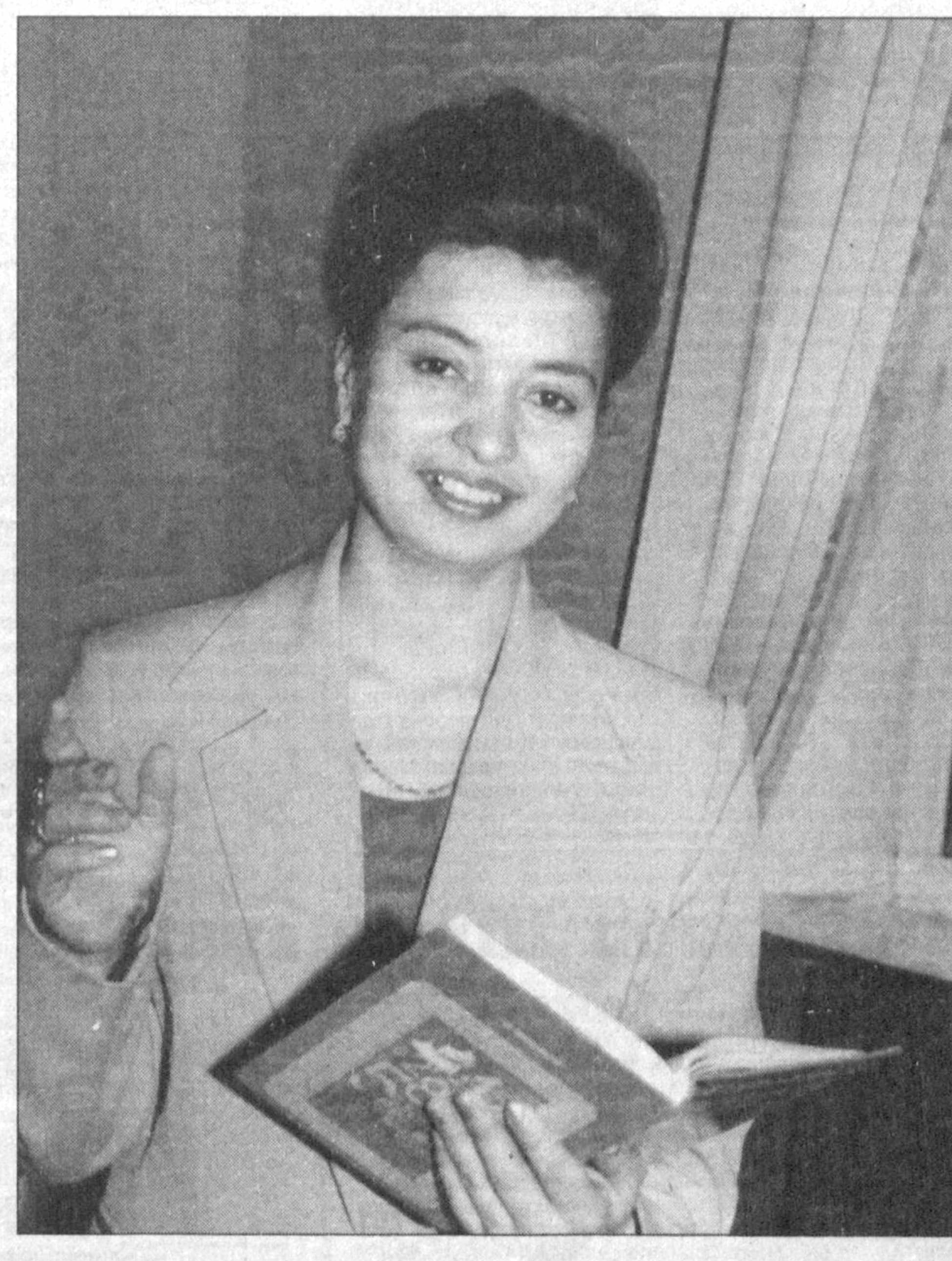
Ўқитувчилик касби муҳим ва шарафлиқ. Ушбу расмида ўқитувчилик касбини улуклаб кам бўлмади.

Буюқ мутафаккир шоир Абдураҳмон Жамий шундай ёзилган: Устод, муаллимиз қандадиган замон, Нодонликдан қора бўлурди жаҳон. Дунёда ҳар қайси касбининг ўзига хос ўрни, аҳамияти, қарқиммати бор. Аммо уларнинг орасида энг улук ва шарафлики бу ўқитувчиликдир. Иброҳон бу касбини улуклаб кам бўлмади. Республика Халқ таълими вазириги томонидан ўлкаликламан