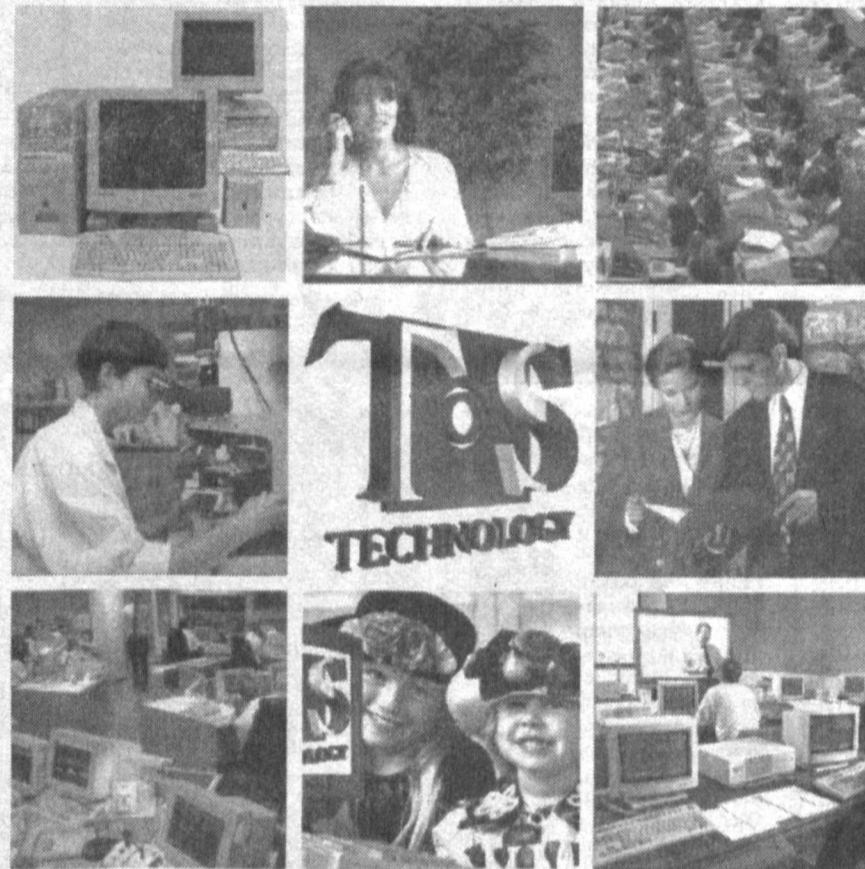
Товар сертификатлаштирилган № NSSUZ.01.002. 511502-02.

TS TECHNOLOGY — жаҳон технологиялари даражасидаги миллий маҳсулот!