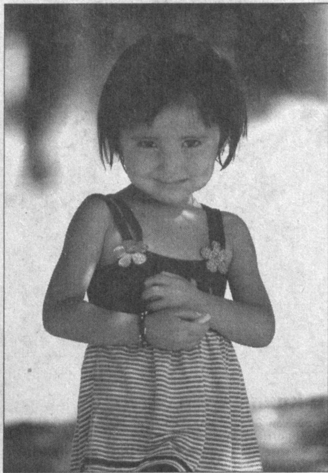
— Уяма қизалоқ, уяма...