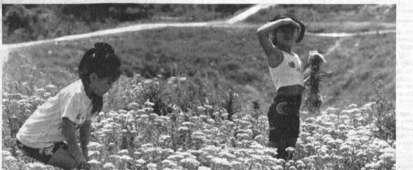
Ёз таассуротларга бой бўлди.

Шрикафан билан журна-листлар ўртасидаги савол-жа-воб тугамасламоқ, муҳташам кортта Евгений Кафельников билан хорватиялик Иван Лубичичлар чиқишди. Рости, шунча Женянинг мухлис-лари ҳаёлидан «унинг тақдир Маратниқига ўхшамасин-да» деган ўй ўтган бўлса, ажаб эмас. Шунинг учунми, улар-нинг учрашувини кўпчилик гулдурас қарсақлар, беҳисоб оқшатиш қуршовида туриб қўзатишди. Йўқ, узаро баҳ-да ҳеч қандай мўъжиза юз бермади. Евгений Кафельни-ков «ҳаш-паш» дегунча даст-лабки сетни ўз фойдасига ун-