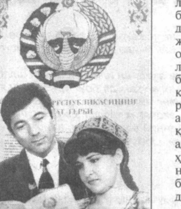
Адолатли жамият қанчалик бўлмасин ҳеч бир замонда, давлат ва жамиятнинг бутун жаҳдаларини мутлоқ қамраб олиши осон эмас. Ривожланган мамлакатлар тажрибасидан шу нарса маълумки, қаерда ҳуқуқий-демократик жамият тамойиллари асосида давлат тузumi йўлга қўйилган бўлса, уша ерда адолатпарвар жамият, инсон ҳуқуқ ва эркинликларни ўзининг нисбатан тўлақонли бўй-бастини намойён этмоқда.

ки, бошқарув идоралари, жамоат ташкилотлари, амалдорлар ва фуқаролар адолатпарвар бўлишлари, барча соҳаларда лозимо унга амал қилишлари керак. 1992 йил 8 декабрда қабул қилинган Узбекистон Конституцияси Асосий Қонуни сифатида ҳуқуқий ислоҳот-