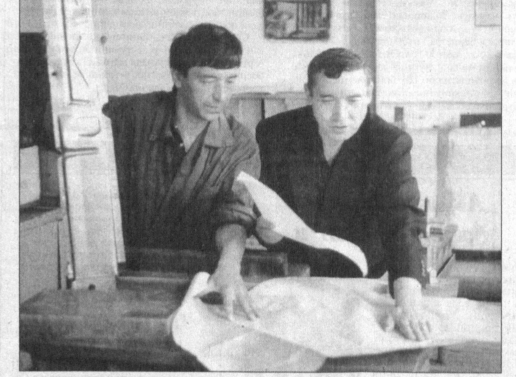
Қўзон электромаш хиссдорлик жамияти Асакадаги «ЎзДЭУавто» қўшма корхонасига бутловчи қисмлар етказиб берадиган жамоалардан ҳисобланади. Мазкур корхона автомобиллар учун зарур эҳтиёт қисмлар тайёрлаш бошланган сўнг, йилга 200 минг АҚШ доллари миқдоридagi валютани тежаси имкони бери. Масаланинг муҳим томини шундаки, бу ерда ишлаб чиқарилаётган 15 хилдан ортиқ бутловчи қисмларнинг барчаси муҳандис-техникларнинг тиҳимсиз меҳнатлари тўғрисида маҳаллий ҳомашедан тайёрланмоқда. Албатта, хиссдорлар бу билан чекланиб қолганича йўқ. Халқ хўжалиги тармоқларига ўндан ортиқ турдаги электр жиҳозлари, маиший хизмат буюмлари етказиб берапти.