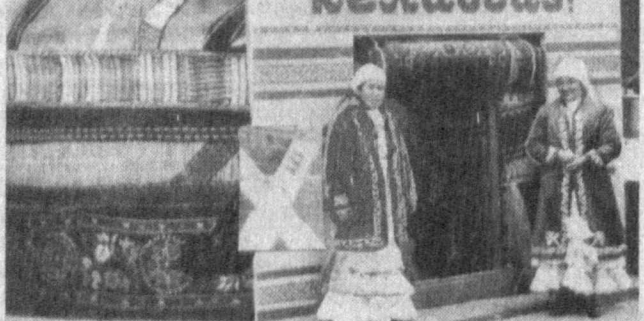
— Қорақалпоғистонни ўзгача меҳр билан севинишингиз сабаби?

— Жуда тўғри. У бамисли уйкудаги инсон. Етган жойидан қўлга олсангиз, уйкудан уйғониб сен эшитмаган, кўрмаган, билмаган воқеалар, ибратли ҳодисаларни баён қила бошлайди.