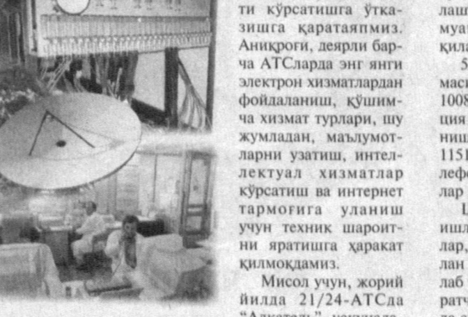
Электрон рақамли ускуналар қўлдандалган ажратма жамловчилар 2160 та номерга мўлжалланган 29-АТС худудида ҳам ўрнатилади. Айни пайтда мазкур худудларда корхона мутахассислари яна

ма АТС эса "Қўйлик" марказидаги халқа йўл бўйлаб қурилган кичик даҳани телефон алоқаси билан таъминлади. Бошқача айтганда, жорий йилнинг ўтган ойлар ичда бу ерда 500 тага яқин янги телефон ўрнатилади. Хозирги кунда шаҳар чеккасида яшовчи яна шу абонентларимизнинг қувончи чексиз бўлаётганини ишончимиз комил. Чилонзор туманида ҳам конструктив ишлар рўйбга чиқарилди. Бу ерда илгари ишга туширилган, 10000 номерга мўлжалланган АТС тармоғининг жумладан, ажратма станция — жамловчи АТС негизинда "118" индексини янги базавий станция яратилди. Бу ўз навбатида оптик толали кабеллар бўйича линияли станцияларро ишоотлар телефон тармоғини турли линияларга аж-