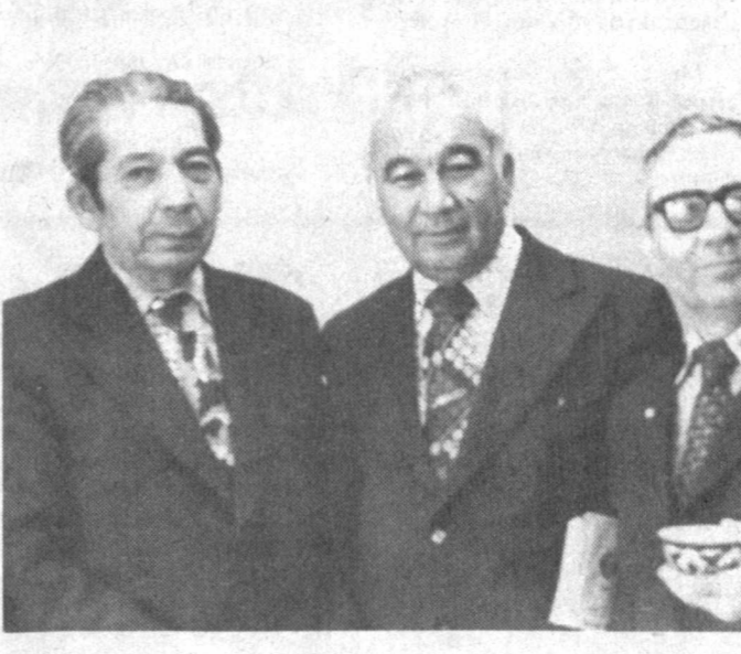
Саид АХМАД, Ўзбекистон Қаҳрамони.

Дўрмоннинг энг сўлим пайти бошланган. Асқад хасталигига қарамай, тиниб-тинч қолди. Эрталаб туриб анжир теради. Уларни ликопчага солиб музлатигича қўяди. Шохида қоқи бўлиб қолган ўрикларни калтак билан қоқайди. У ёзиб-чишиб ўтирадиган жойдан уч-тўрт қадам нарида бир туپ "қирқ оғайни" гули бор. У олдий гуллардан эмас. Қил-қизил бўлиб очилганда уйғур мангисидек катта бўлиб кетади. Уруғ боғлаган новдаларини кесиб турса, кетма-кет, дам олмасдан очилаверади. Асқад ундан қаламча кесиб, офтобрий жойга сўқиб қўйган. Утган йилги қаламчалар яхши илдириб олиб, бир-иккитаси гул кўрсатади. Баҳор келиши билан бу қаламчаларни боғ қўшиларига икки-учтадан тарқатади. Асқад ўша кезлари бошқа ишларни қўйиб, берилиб шеърлар ёзаётган эди. Кўпинча у қоғоз сўраб келарди. У жуда инсофли, диннатли одам эди. Журналга бош муҳаррир бўлатуриб, таҳриратий машинасида юрмасди. Ишга пилла бориб-келарди. Ишхонадан иккетасида бўйсин қоғоз олиб кетмасди. Ишдан қайтишда ўра гузаридики магазиндан қоғоз, блокнот, қалин муқовали "общий дафтар" сотиб оларди. У ёзи билан боғида ижод қиларди. Небаралари ҳам ўзига ўхшаган олобди, қобил болар эди. Асқад қанлоқ иш буюрсак, дарров бажаришарди. Сентябрь бошланиб, болалар шахарга кетишган. Боғда эр-хотин икковлари қолтишган. Қулави Франциядан меккант узумининг қўчанини олиб келган, дарвозадан кириверишга экиб берган эди. Асқад кунига неча мартадаб узум тепасига борган. Яқин дўстларига атир ҳиди келиб турган узумдан битта гужум узиб берди. Ошонча ёнида икки туپ