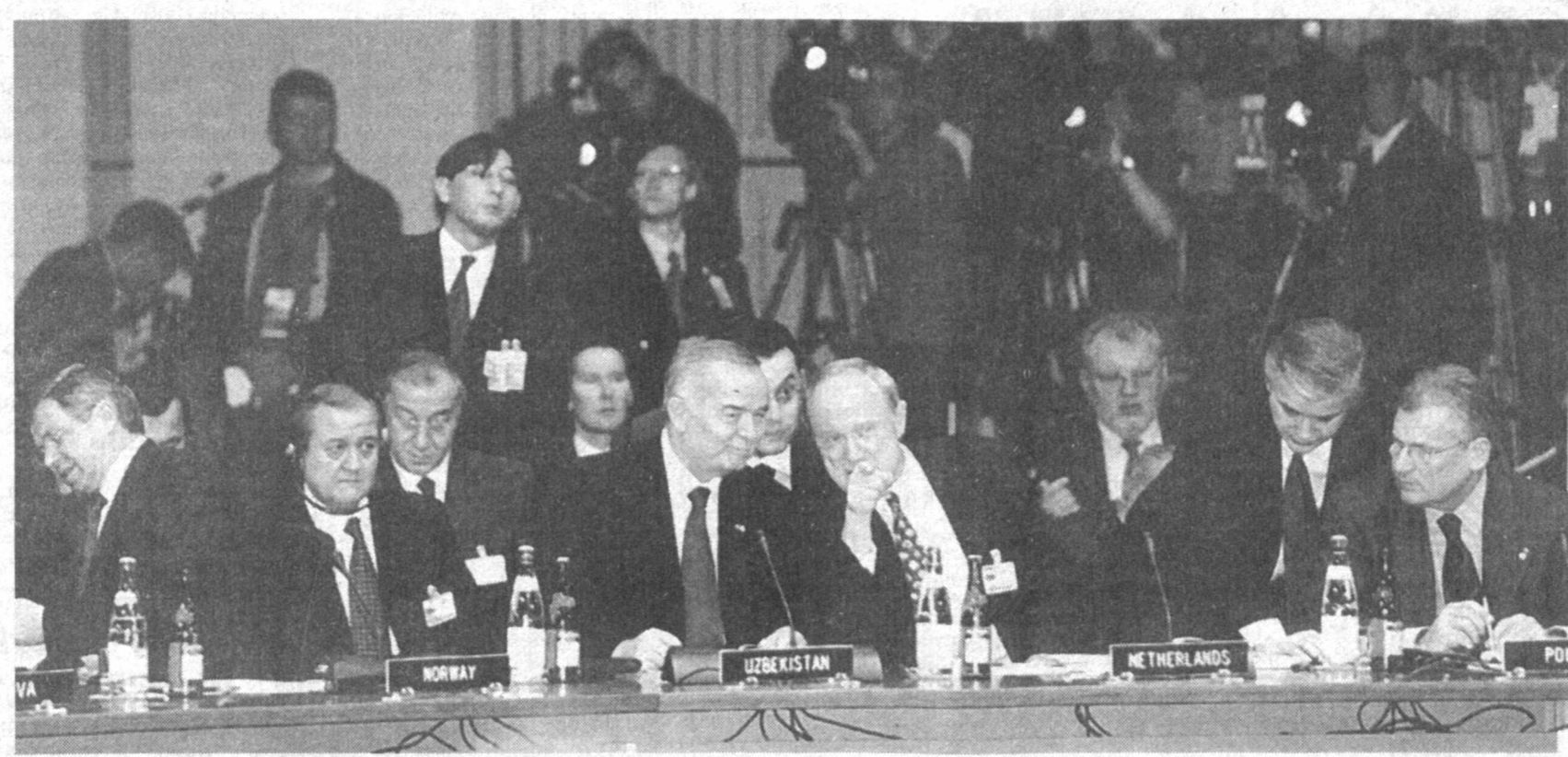
Ўзбекистон Республикаси Президенти Ислам Каримов 21 — 22 ноябрь кунлари НАТО ва Евроатлантика ҳамкорлик кенгашининг Прага саммитида иштирок этди

Президентимиз Прага сарафининг биринчи кунин НАТО Бош қотиби Жорж Робертсон, иккинчи кунин эса АҚШ Давлат қотиби Колин Пауэлл ҳамда Франция Президентини Жак Ширак билан учрашди. Ушбу учрашувларда асосий диққат-эътибор хавфсизлик масаласига қаратилди. Бу — табиий. Зеро, НАТО аъзолари ва ҳамкорларининг бир ташкилот афродида жипслашувидан кўзланган мақсади ҳам миллий, минтақавий ва дунёвий хавфсизлик ва барқарорликни мустақамлашдан иборат.