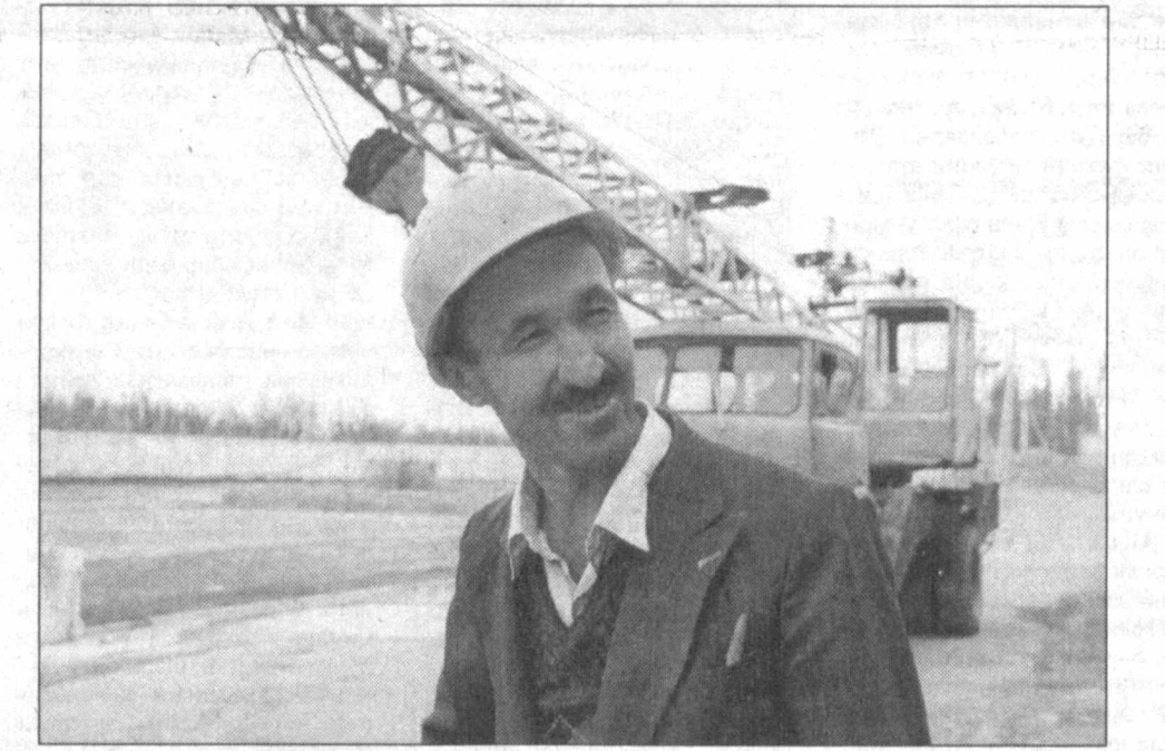
Қўрғонтепа туманининг Ойим қишлоғида ўзбек-хитой ҳамкорлиги меvasи — «Ойимтекти» кўма муҳассилига тўлиб элиаётир. Махаллий хонашобан экспортбо махсулотлар ишлаб чиқаришга мўлжалланаётган ушбу корхона ишга тушса, «Наврўз» Жалпақов номли, «Ўзбекистон» ширкат ҳўжалликлари шолikorларининг ҳиссаси катта бўлиб...