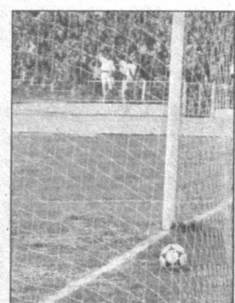
Чиснинг майдондан четлатилиши қандай мумкин?

— Бундан ташқари, «Трактор»нинг «Сўғдиёна» устидан эришган ютуғи анча ажабланирди бўлди. Меъзолилар дарвозасига белгиланган пенальтини, ҳатто бир ўйин-