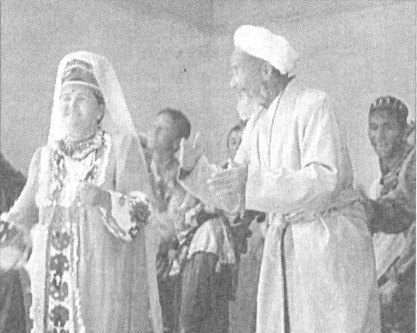
Авадимагма Бешик, аждоимга қадр, Шу азиз Ватандир, овоз Ватандир.