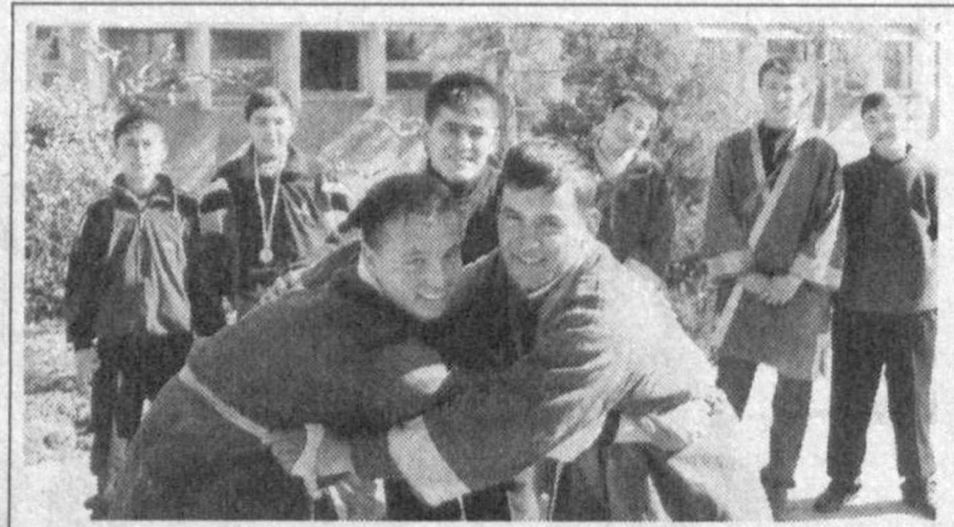
Бугунги кунда жисмоний тарбия ва спортга берилаётган эътибор давлат сиёсати даражасига кўтарилгани бокс, юртимизнинг чекка-чекка қишлоқларида ҳам спортнинг кўпинча турлари бўйича ўзгариш қўраётган ёшлар сони тобора ортиб бормоқда. Андижон вилоятидаги Хўжаобод туманида ҳам елкаси ерга тегмаган болалар кўп. Айни пайтда туманида 20 нафардан ортиқ белбоғли кураш бўйича Ўзбекистон чемпионли, 4 нафар Урта Осиё чемпионли бор. Бу ерда 17 та кураш билан шугулланишга мослаштирилган машғулот жойлари бўлиб, унда 10 ёшдан 18 ёшгача бўлган ўсмирлар кураш сир-асоратларидан сабоқ олмақдалар.

Футбол секциясининг 289 нафар иқтидорли спортчиси бор. Болалар 26 гуруҳга бўлинди, ўз маҳоратларини оширмоқдалар. Мазкур мактаб болалари ўтган йили вилоят босқичида иккинчи ўринга сазовор бўлдилар. 16 нафар чарм тўп устаси вилоят спорт мактабига ўқишга тақдир этилди. Улар ҳадемай мамлакат спортининг юлдузлари бўлсалар, ажаб эмас.