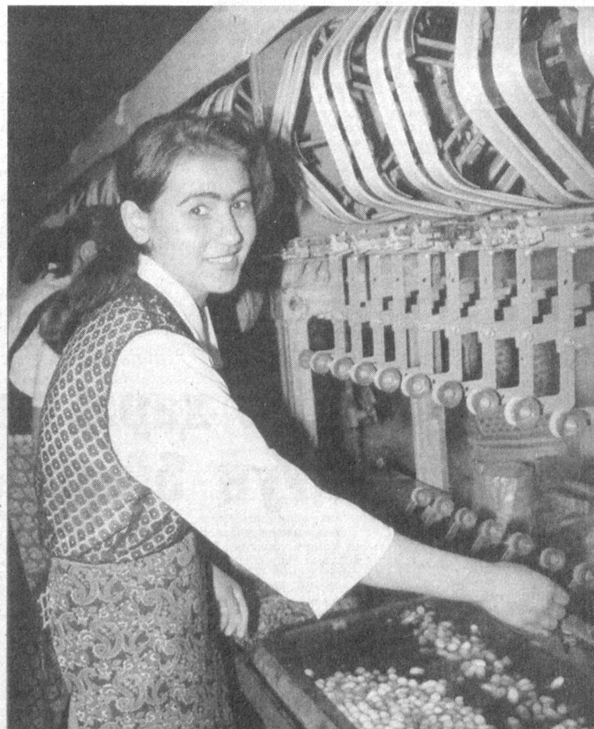
Бугунги кунда мамлакатимизда қўшма корхоналар сони кўпайгандан-кўпаймоқда. Бу эса юртимиз равнақига, иқтисодий ўсишига ижобий таъсир этади. Жорий йилнинг январь ойида ўз фаолиятини бошлаган Раҳимов туманидаги "РомСиб" Ўзбекистон-Россия қўшма корхонаси ҳам бу борада муҳим аҳамият касб этади. Корхона пилани қайта ишлаш ва пахта толасидан тайёр маҳсулот, кийим-кечақлар ишлаб чиқаришга ихтисослашган. Бу ерда ишлаб чиқарилган маҳсулотлар қисқа муддат ичида харидорлар назарига тушиб улгурди. Албатта, бундай ишонч корхона ривожига яхши самара беради.

Вазирлар Маҳкамасининг Раиси Тошкент шаҳри, 2003 йил 17 апрель. И. КАРИМОВ