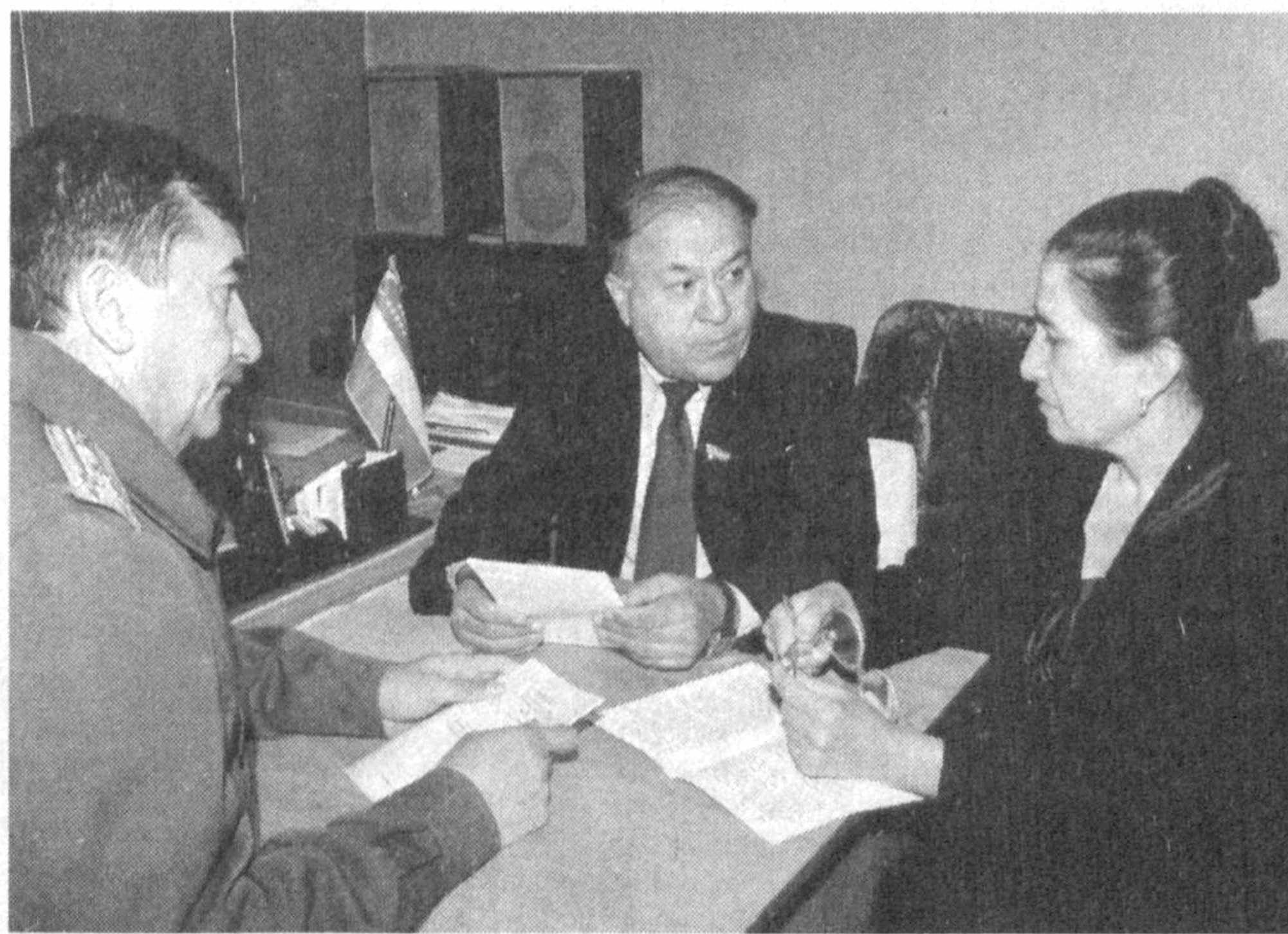
Парламентнинг ўн биринчи сессияси муҳокамасига киритилган қонунлар лойиҳалари жойларда ҳам кенг муҳокама қилинмоқда. Фуқароларимиз сессия кун тартибига фуқаролик жамияти асосларини яратувчи қонунлар лойиҳалари қўйилганини тавқиллаш билан бирга ўз тақлиф ва мулоҳазаларини ҳам билдиришмоқда.

5. Белгилаб қўйилсинки, 2003 йил 1 февралдаги ҳолатига кўра устав фонди Ўзбекистон Республикаси Марказий банкнинг курси бўйича 50 миң АҚШ долларидан кам миқдорда бўлган илгари ташкил этилган акциядорлик жамиятлари 2004 йил 1 январгача ўз устав фондларини қайта рўйхатдан ўтказиш санасида кўрсатиб ўтилган суммалар кам бўлмаган миқдорга келтиришлари ёқунданди. Кичик гуруҳларнинг раҳбарлари М. Сафаров, У. Хошимов ва И. Қаландаровнинг ахборотларида айтиб ўтилганидек, сессия муҳокамасига киритилаётган қонун лойиҳалари ва бошқа материаллар депутатларга ўз вақтида юборилди. Сийёсий партияларнинг депутатлар фракциялари ва депутатлар блоклари билан, сайловчилардан, ташкилотлар, муассасалар ва жамоат бirlашмаларидан тақлифлар кўп тушиди ва бу тақлифлар Олий Мажлис кўмиталарида диққат билан ўрганилиб,