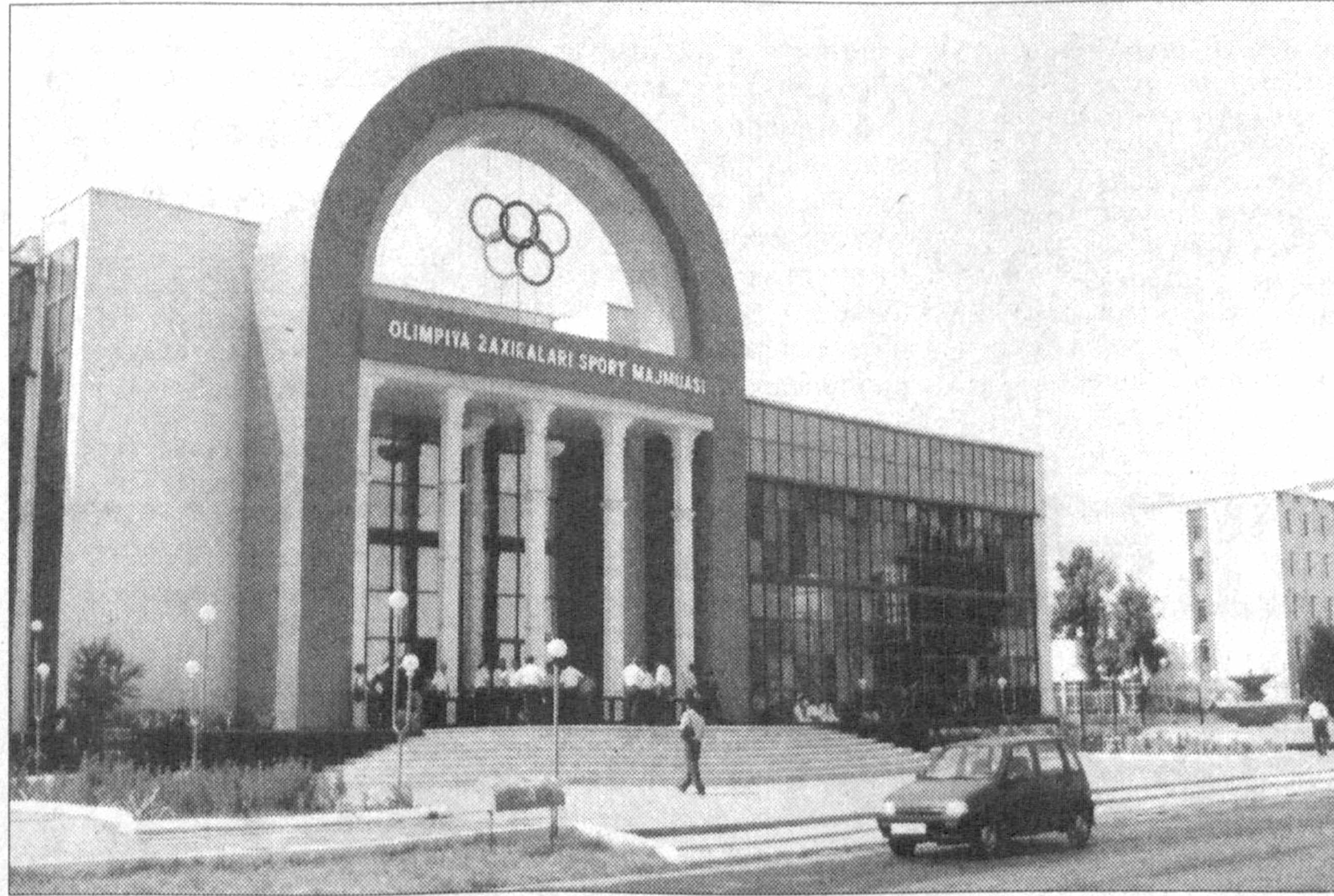
Жиззах шаҳри кун сайин ўзгариб бормоқда. Замонавий турар-жой бинолари, спорт иншоотлари, равоён йўллари шаҳар ҳуснига ҳусн қўшаётти. Олимпия захиралари спорт мажмуаси эжаҳон андозалари талабларига тўлиқ жавоб берадиган даражада бунёд этилган. Ҳозир бу ер ёшларнинг сеvimли масканига айланган бўлиб, мажмуада ўсириллар спортнинг бир неча тури билан мунтазам шуғулланишмоқда.