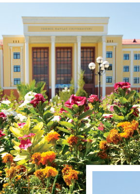
Сурхондарё вилояти маркази — Термиз шаҳри чиндан ҳам истиқлол йилларида гуллаб-яшнади. Бу ерда замонавий архитектура ютуқлари асосида бунёд этилган янги турар-жойларда, асосан, ёш оилалар истиқомат қилишмоқда.

Воҳанинг шимолий шаҳарларидан бири — Деновда амалга оширилган бунёдкорлик ишларидан ҳам кўнглингиз ёришади. Кўп қаватли уйлар,