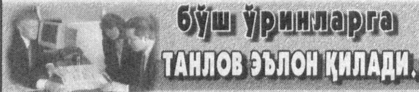
бўш ўринларга танлов эълон қилади.