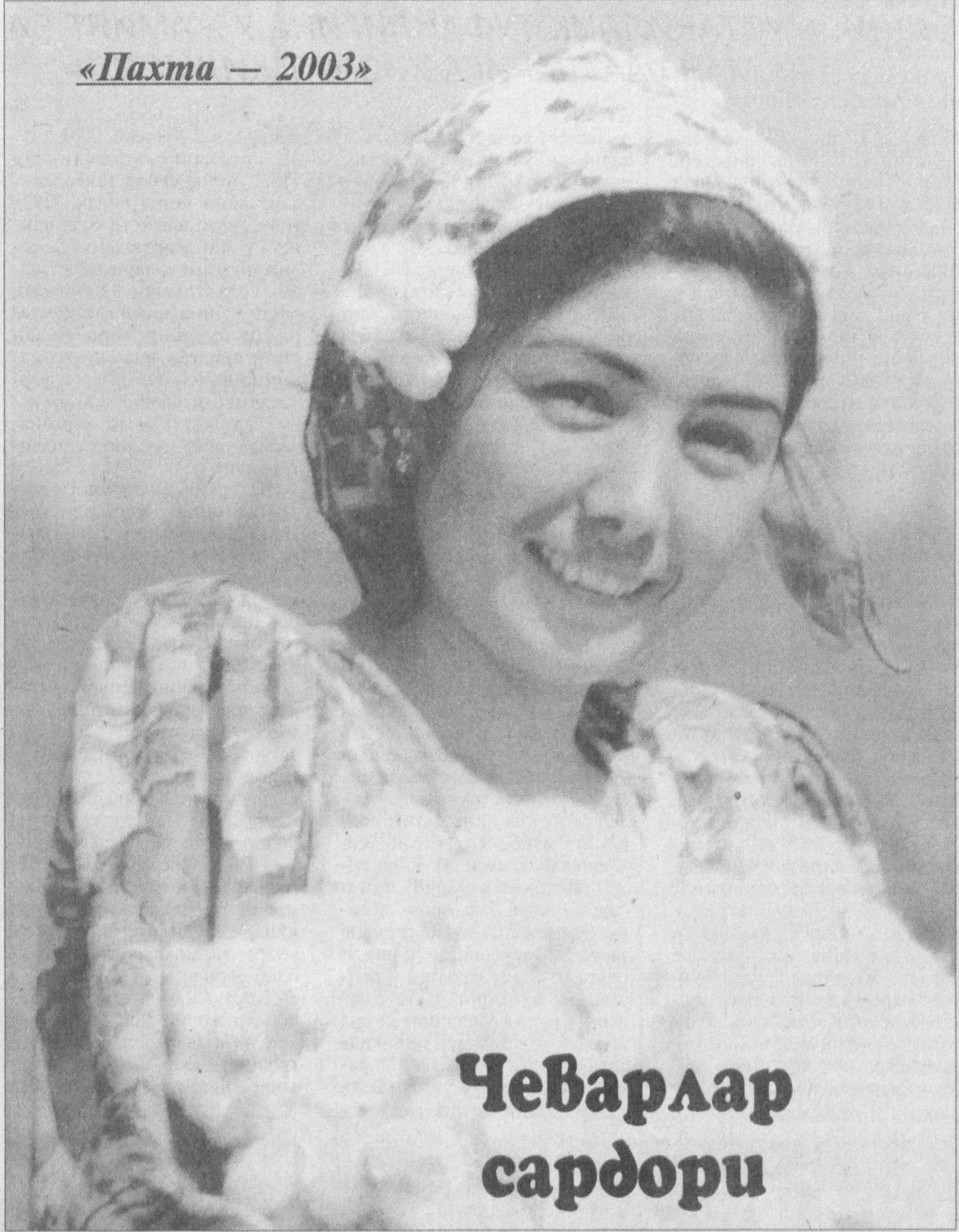
«Пахта — 2003»