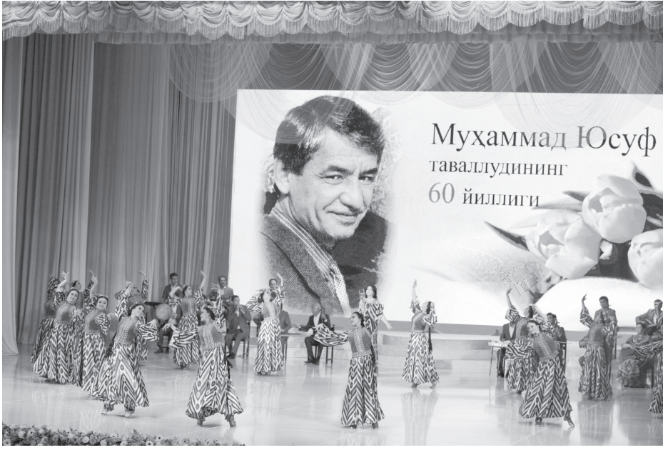
(Давоми. Бошланиши 1-бетда).

Унинг истиқлолимизга садоқат, она-Ватанга муҳаббат туйғуларини маҳорат билан тараннум этган шеърлари, дос-