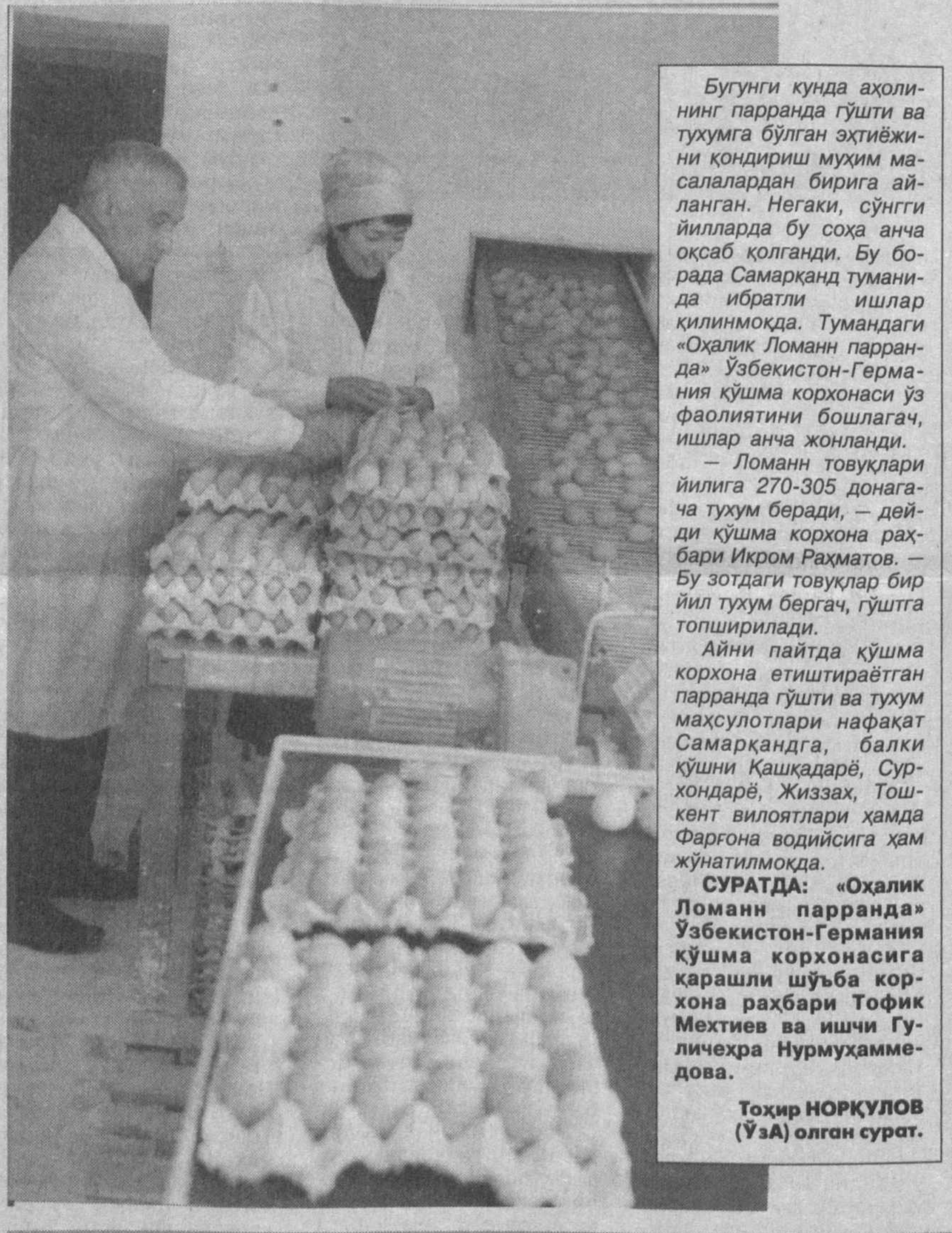
Бугунги кунда аҳолининг парранда гўшти ва туҳумга бўлган эҳтиёжини қондириш муҳим масалалардан бирига айланган. Негаки, сўнгги йилларда бу соҳа анча оқсаб қолган. Бу борада Самарқанд туманида ибратли ишлар қилинмоқда. Тумандаги «Оҳалик Ломан парранда» Ўзбекистон-Германия қўшма корхонаси ўз фаолиятини бошлаётган, ишлар анча жонланди.

Фермер хўжаликлари ҳам қиш. «Хўжаликнинг асосий таянчи ҳисобланади. Уларнинг муваффақиятли фаолияти аҳолининг истеъмол товарларига бўлган талабини қондирибгина қолмай, мамлакатимизнинг экспорт салоҳиятини оштиради. Фермер хўжаликлари эришадиган ютуқларнинг асосий омилли уларнинг моддий манфаатдорлигидадир. Хозирги кунда мамлакатимизда фермер хўжаликларининг фаолият юритиши учун барча шарт-шаритлар ва конуний асос яратилган. Акциядорлик-тижорат «Тадбиркорбанк»и ҳам ислотларнинг бевосита иштирокчиси сифатида кичик бизнес субъектларини қўллаб-қувватлаш, уларнинг кредит ресурсларига бўлган