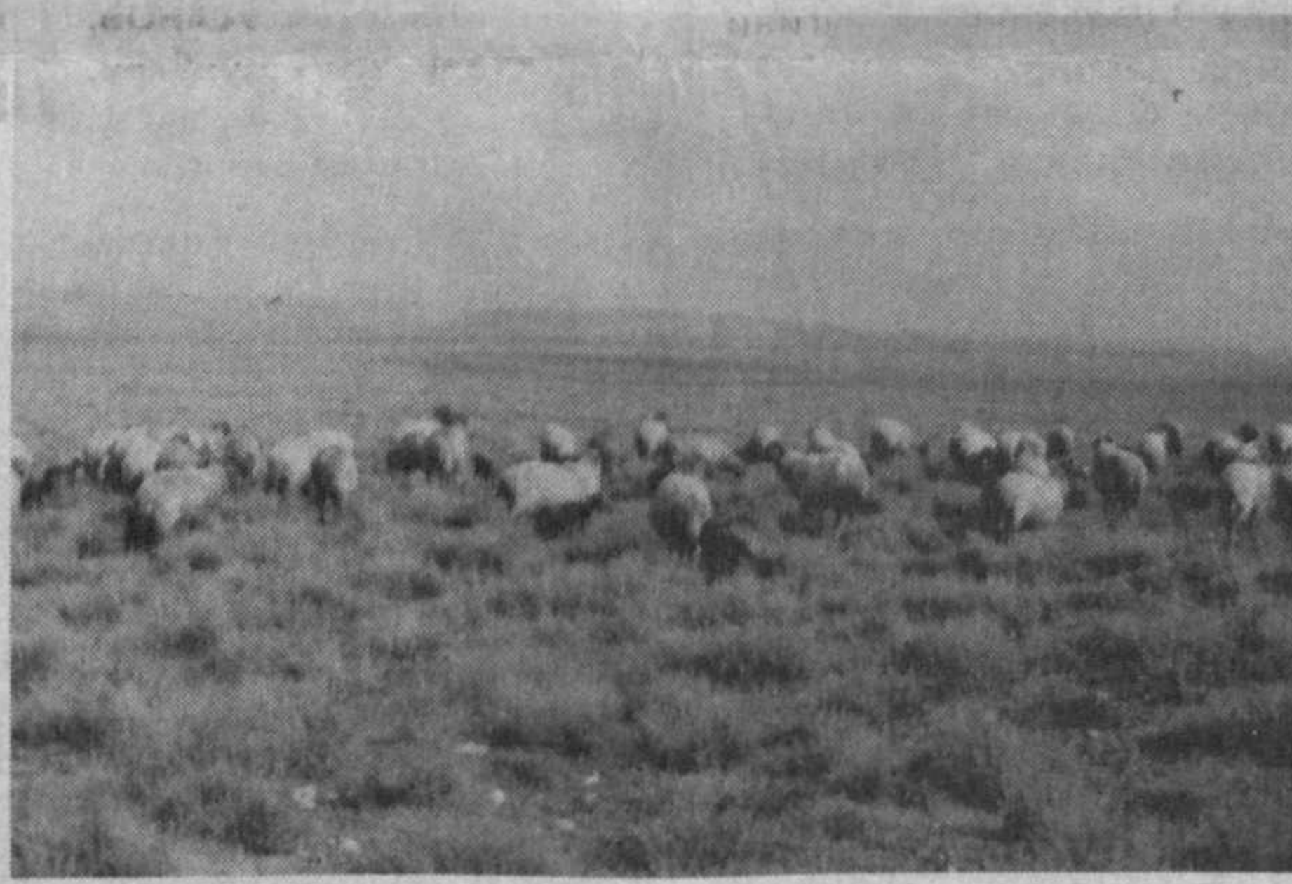
СУРАТЛАРДА: илгўр чўпон Мели Арабов; ҳўжалик яйловларида.

Пахтачи туманидаги «Қарнаб ота» ширкат ҳўжалигида чорвачиликни ривожлантириш учун кенг яйловлар ва катта имкониятлар мавжуд. Аини пайтда бу ерда 21600 бош қўй парвариш қилинмоқда. Ҳар йили баҳор вақтида ўтказиладиган кўзилаштириш мавсумига алоҳида эътибор берилётганлиги боис ўстиришга қўйдириладиган жониворлар сони кўпаяпти. Шу боис қўйлар бош сони ҳам йилдан-йилга ошиб бормоқда. Натижада ҳўжалик соҳадан ҳар йили катта даромад олаёпти. Қўлга киритиладиган ютуқларда, табиийки, чўпонларнинг ҳиссаси катта.