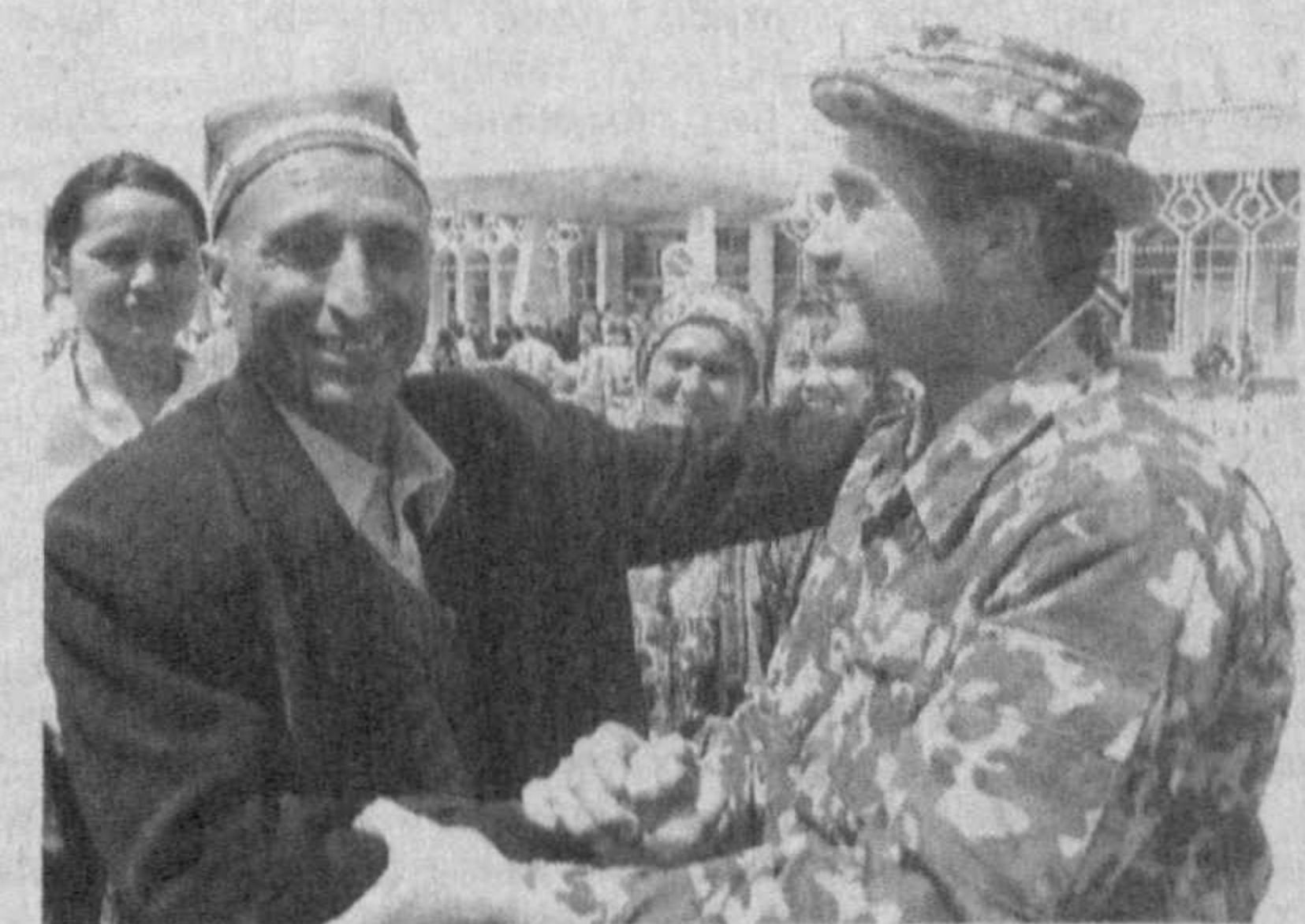
публика Оқсоқоллар кенгаши ва "Маҳалла" жағмараси раиси Аъзам-