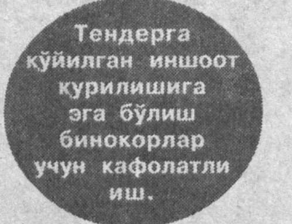
Тендерга қўйилган иншоот қурилишга эга бўлиш бинокорлар учун кафолатли иш.