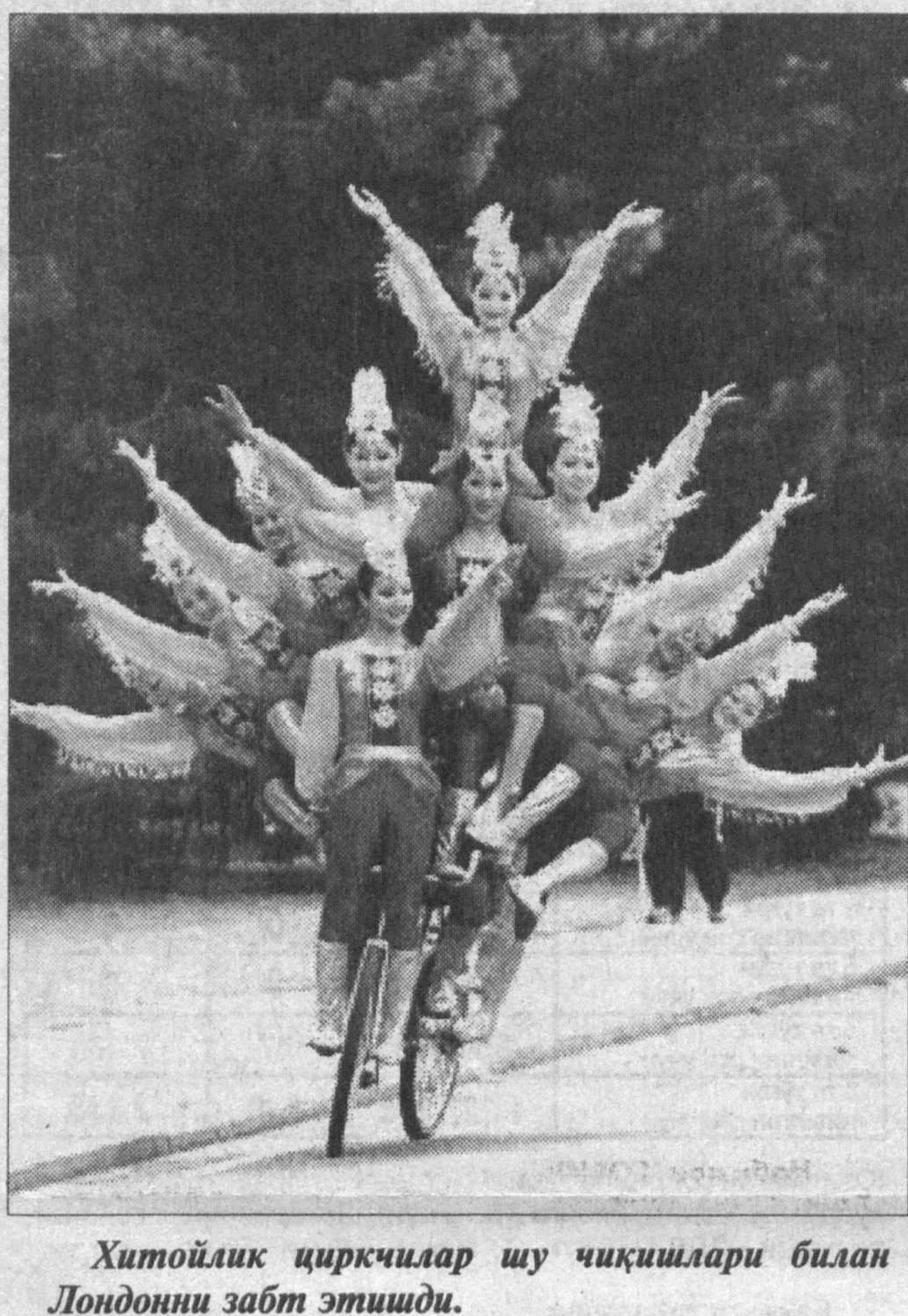
Хитойлик циркчилар шу чиқишлари билан Лондонни забт этишди.