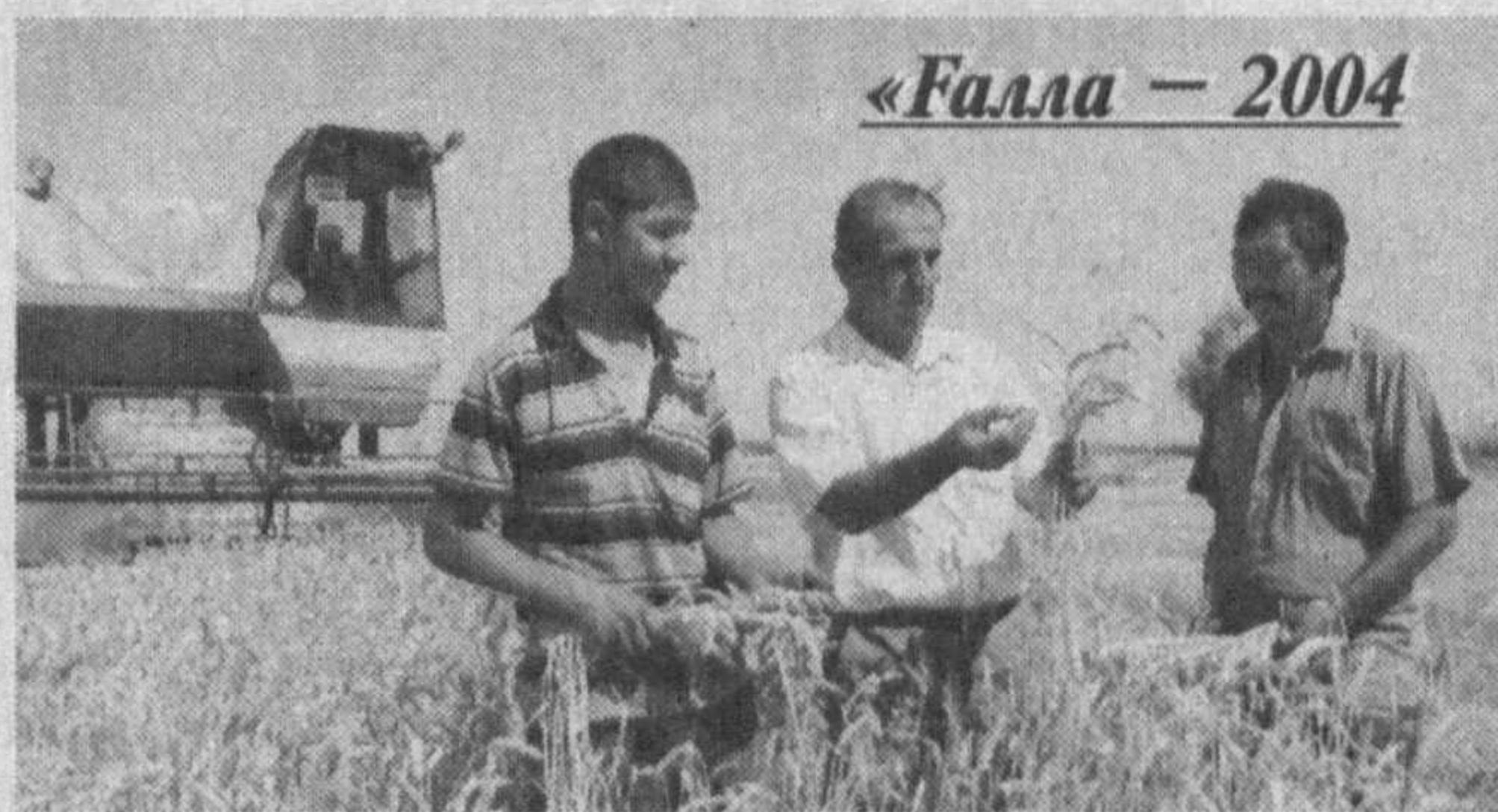
«Галла — 2004»

Ижодий ишлар шу йилнинг 10 августига қадар қуйидаги манзилга юборилиши лозим: Тошкент шаҳри, Навоий кўчаси, 30-уй. Республика «Тасвирий ойна» ҳамда Журналистлар ижодий уюшмалари. Телефонлар: 144-57-24; 144-37-87