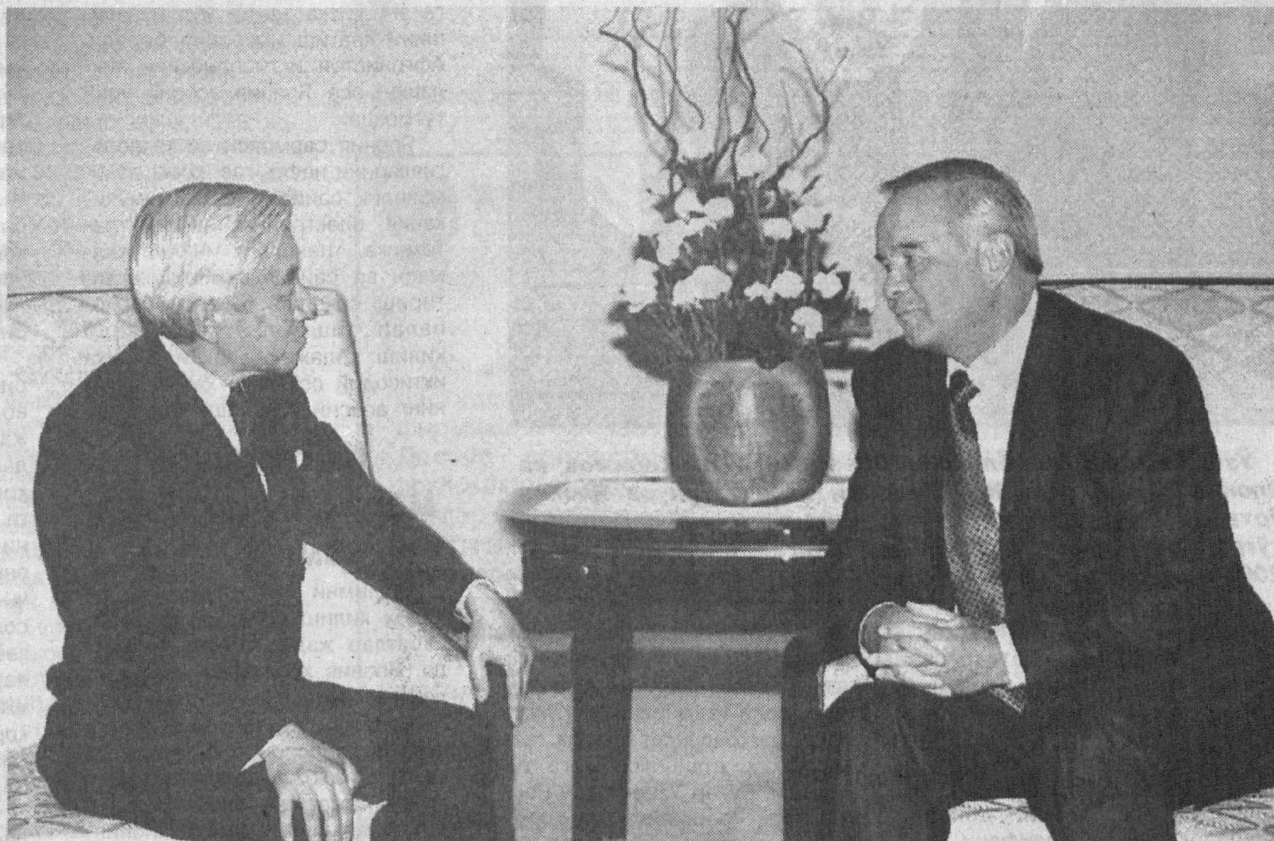
Ўзбекистон Республикаси Президенти Ислам Каримов Япония Императори Акихито билан суҳбатлашмоқда.

21 июль куни Япония пойтахти Токио шаҳрида Ўзбекистоннинг Япония билан ҳамкорлик кўмитаси ва Япониянинг Ўзбекистон билан ҳамкорлик кўмитасининг биринчи кўшма мажлиси бўлиб ўтди. Ўзбекистон Республикаси Президенти Ислам Каримов 2002 йилнинг июлида Японияга расмий ташрифи чоғида ушбу кўмиталарни ташкил этиш ташаббусини илгари сурган эди.