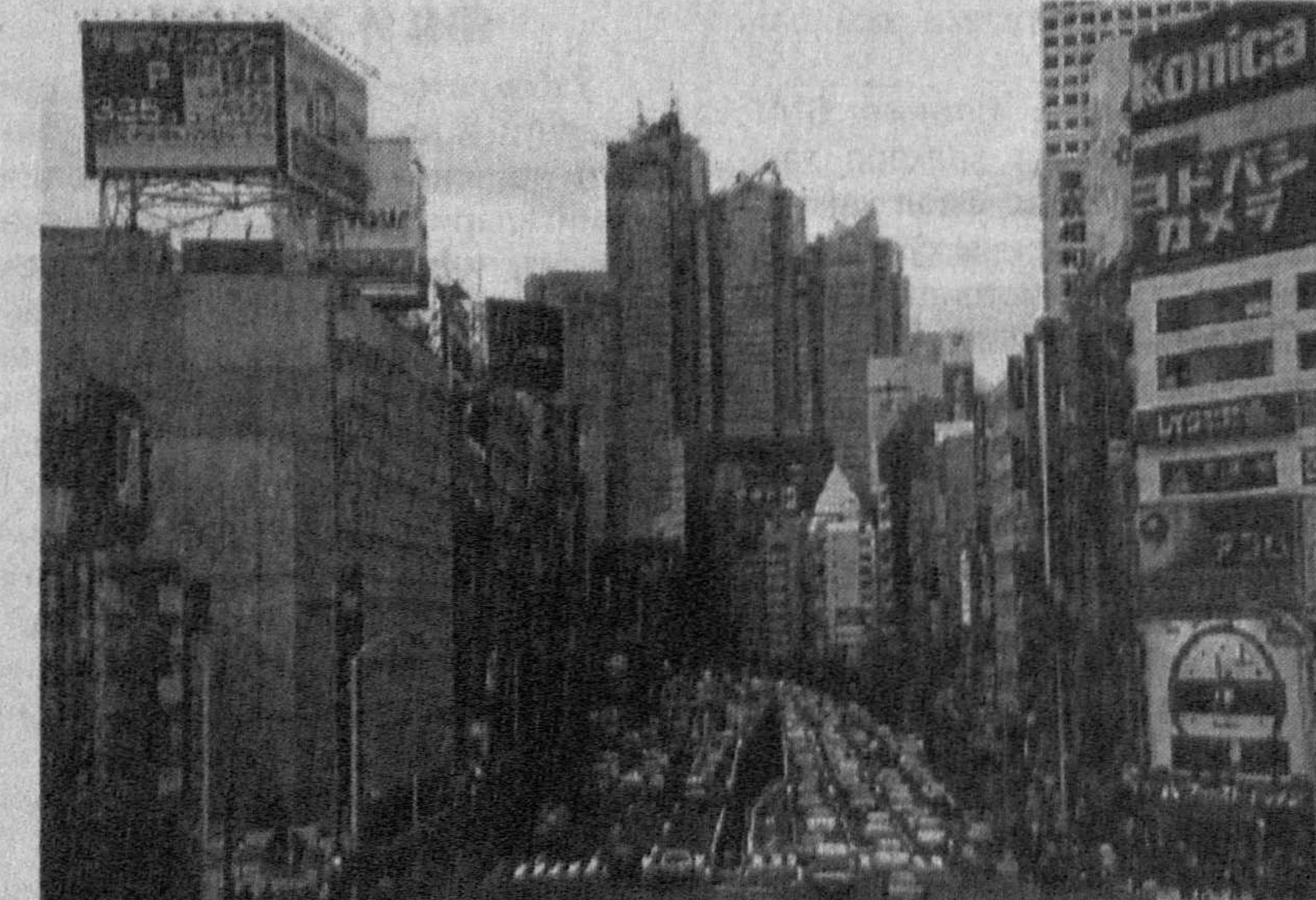
Япония иқтисодий ривожланиш бўйича Осиед қитъасида биринчи, жаҳонда иккинчи ўринда туради.