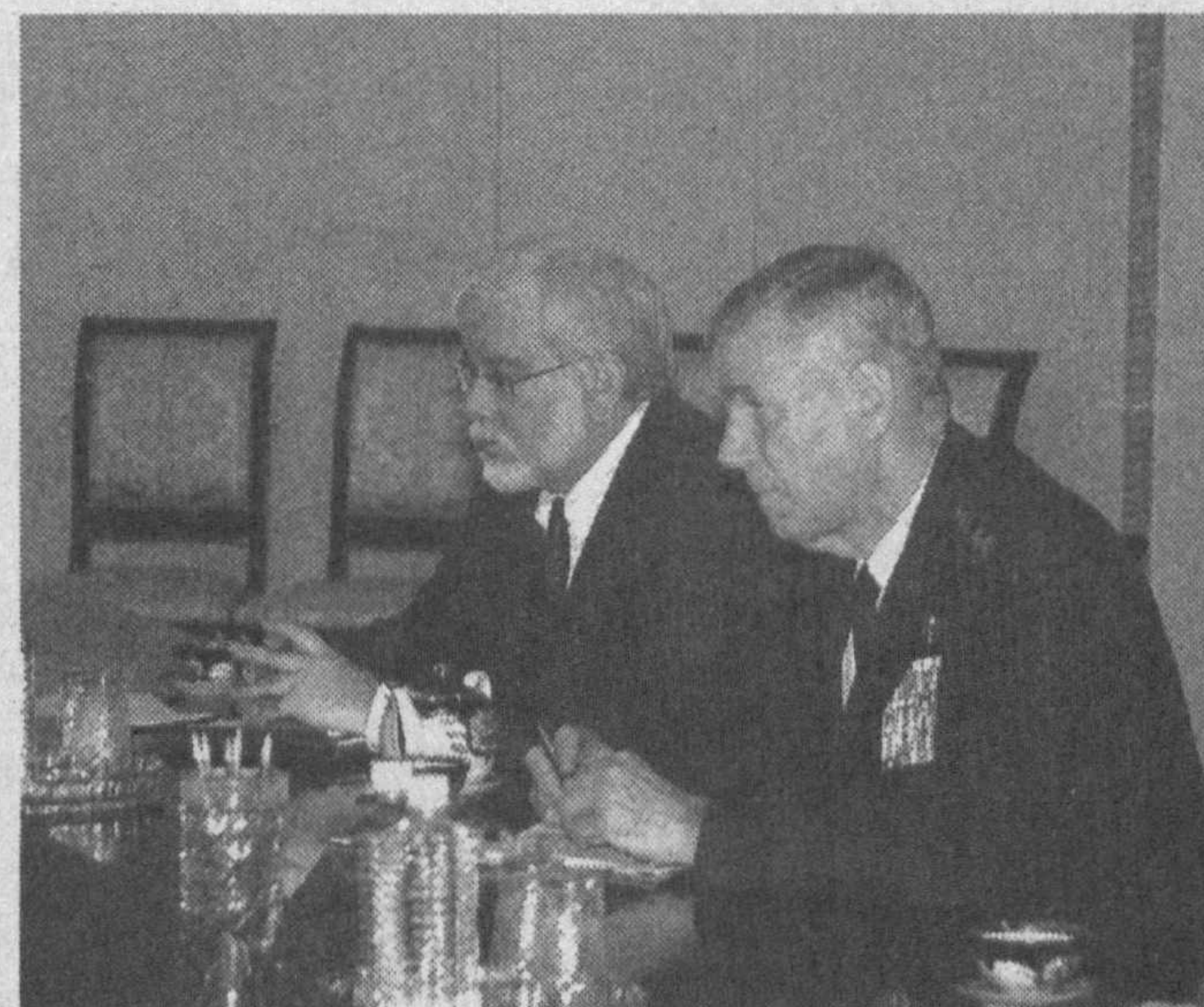
ЎЗА. СУРАТЛАРДА: қабул пайти.

Ўзбекистон Республикаси Президенти Ислам Каримов 12 август куні Оқсаройда АҚШ Куролли кучлари штаб бошлиқлари бирлашган кўмитаси раиси Ричард Майерсни қабул қилди.