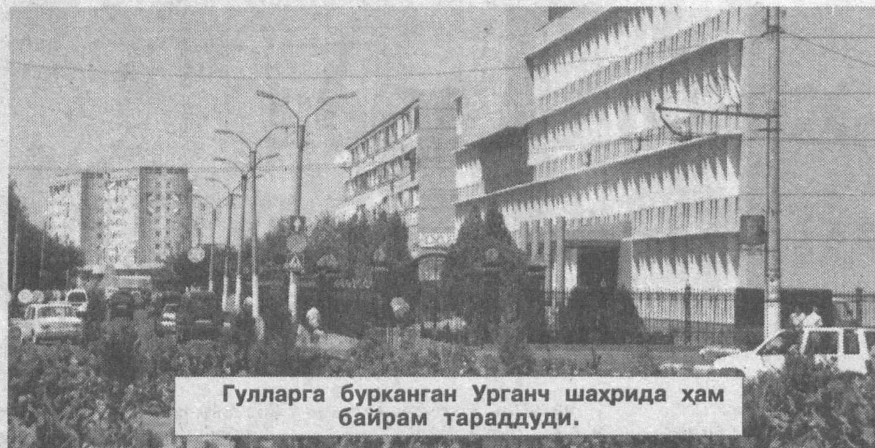
Гулларга бурканган Урганч шаҳрида ҳам байрам тараддуди.

Тўйга не етсин. Тўйлар фасли яқинлашапти. Ўғил уйлаб, қиз чиқармоқчи бўлган хонадонлар оқланиб-кўкланиб, орастаю оройишланиб бўлинди. Ҳовли саҳни ҳам кўркамгина, саранжом-сариштагина бўлди-қолди. Ҳатто дарахтларга ҳам хусн инди — ортиқча шох-бутоқлари кесилгач, кўкка бўй чўзаётгани сезилди. Остонадан ҳатлаб кўчага чиқинг. Дарвозалар мойланиб, деворлар оқланган. Ишқомдаги ток новдалари, баргларининг ҳам биронта ортиқчаси йўқдек, ҳаммаси териб қўйилганга ўхшайди. Чор-атроф ҳам текисланди.