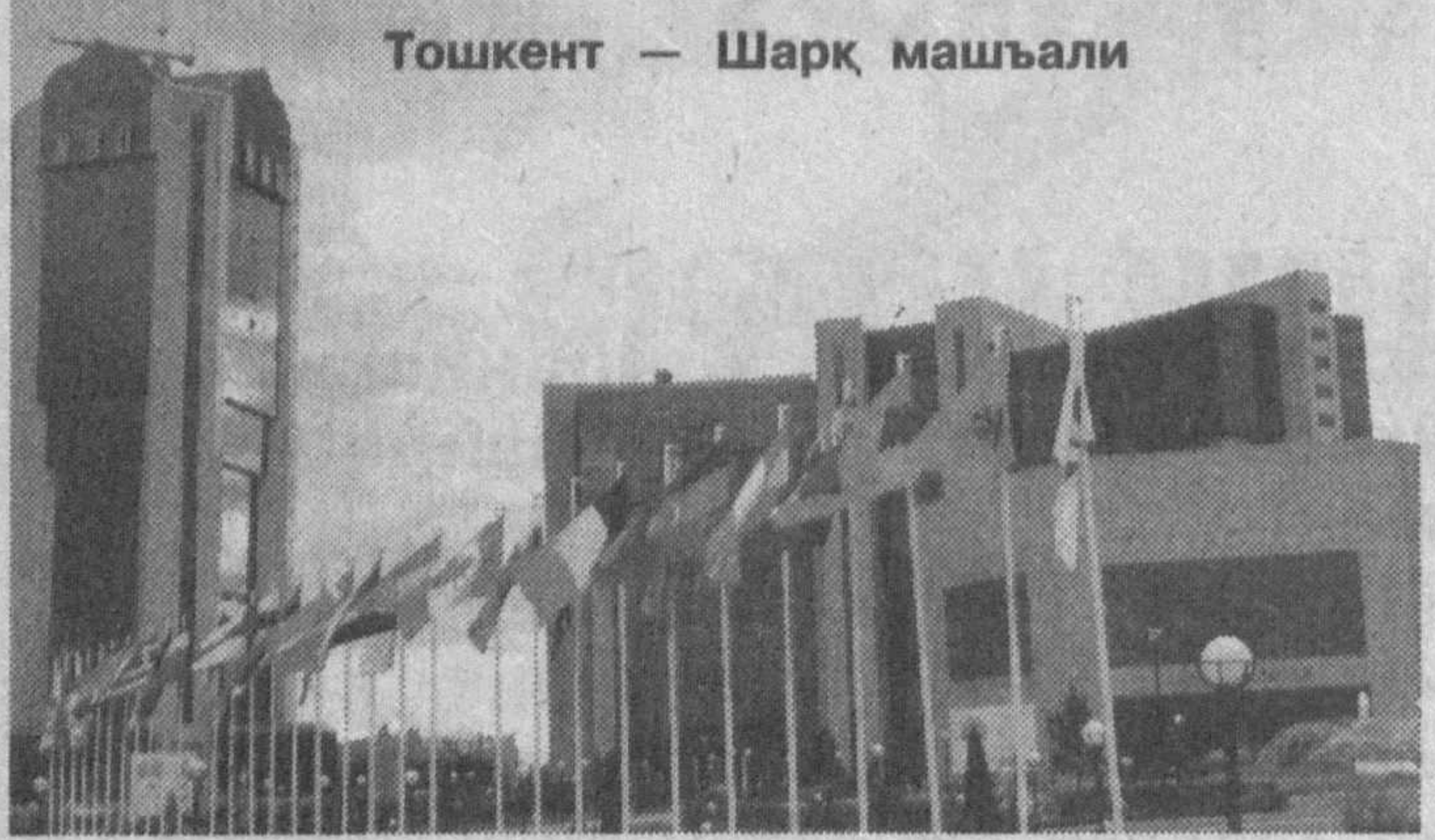
Тошкент — Шарқ машъали

рими чиройига чирой қўшаяпти. Дарахтларнинг бир текисда буталгани, поклик-оқлик билан бўялгани ҳам киши руҳиятига кўтаринкилик бағишлаши, шубҳасиз.