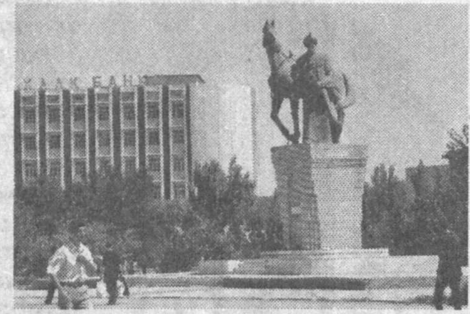
«Гул, спорт ва саломатлик шаҳри», деб таърифламоқдалар. Бу бежиз эмас.

Хиванинг 2500 йиллиги, Жалолиддин Мангуберди таваллудининг 800 йиллигига «Авесто»нинг 2500 йиллиги, «Умид ниҳоллари» спорт ўйинларига тайёргарлик кўриш жараёнида Урганч шаҳри қиёфаси тубдан ўзгарди. «Авесто» ҳамда Жалолиддин Мангуберди ёдгорлик мажмуалари, кўлаб боғлар, спорт иншоотлари, маъмурий бинолар унинг хуснига холдек ярашди. Бугунги кунда урганчликлар фахр ва ифтихор ила ўз шаҳарларини «Гул, спорт ва саломатлик шаҳри», деб таърифламоқдалар. Бу бежиз эмас.