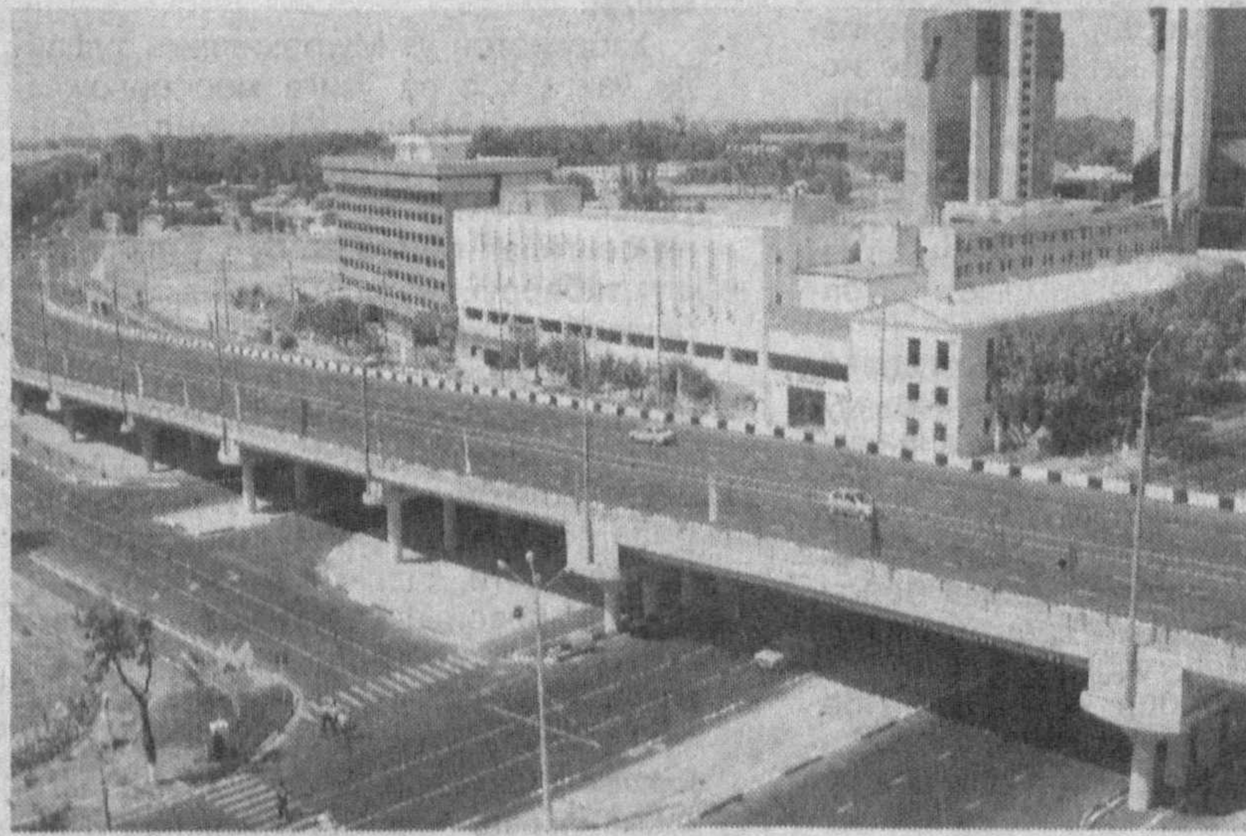
СУРАТЛАРДА: пойтахтдаги янги бунёдкорлик ишларидан лавҳалар.