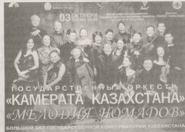
ГОСУДАРСТВЕННЫЙ ОРКЕСТР «КАМЕРАТА КАЗАХСТАНА» «МЕЛОДИЯ НОМАДОВ» БОЛЬШОЙ ЗАЛ ГОСУДАРСТВЕННОЙ КОНСЕРВАТОРИИ УЗБЕКИСТАНА

В музыкальном репертуаре, который мы представляем, звучат мелодии, написанные не только