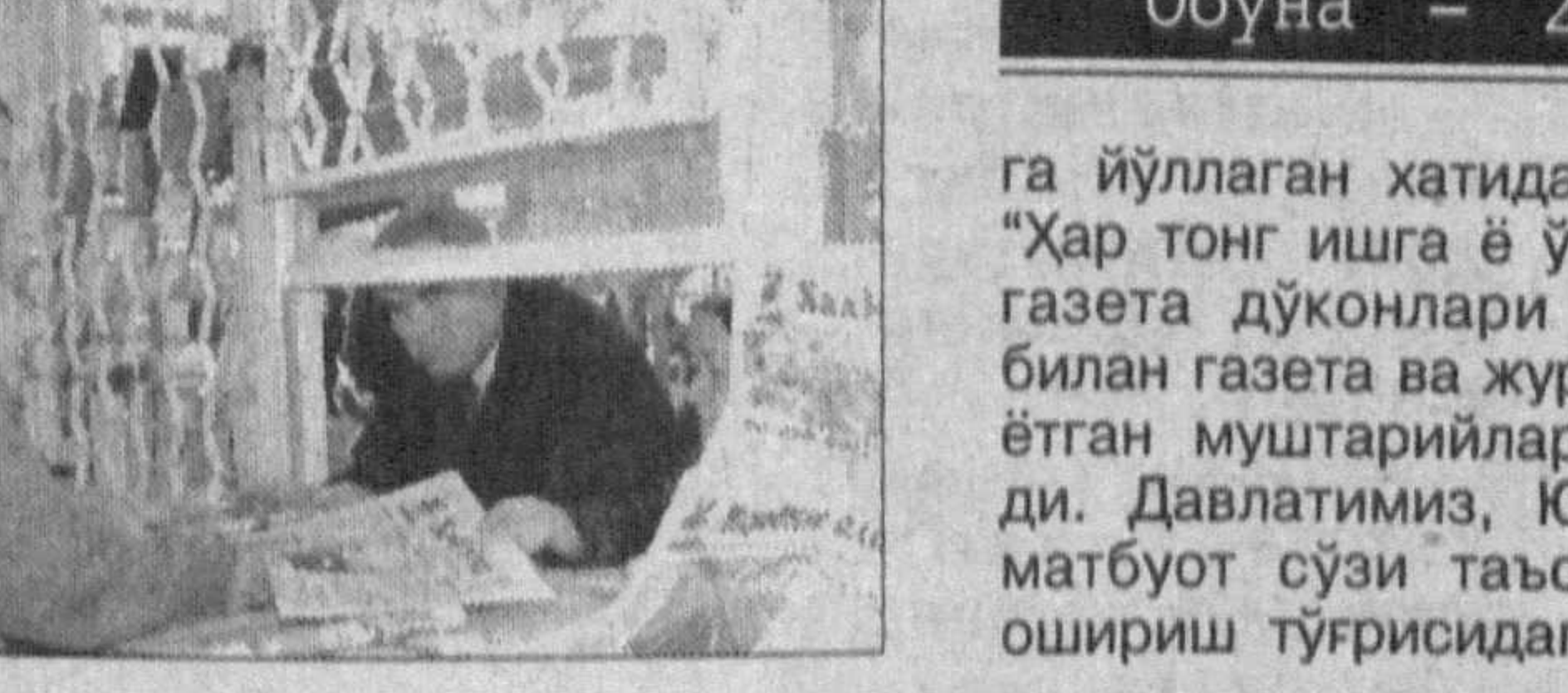
Обуна — 2005