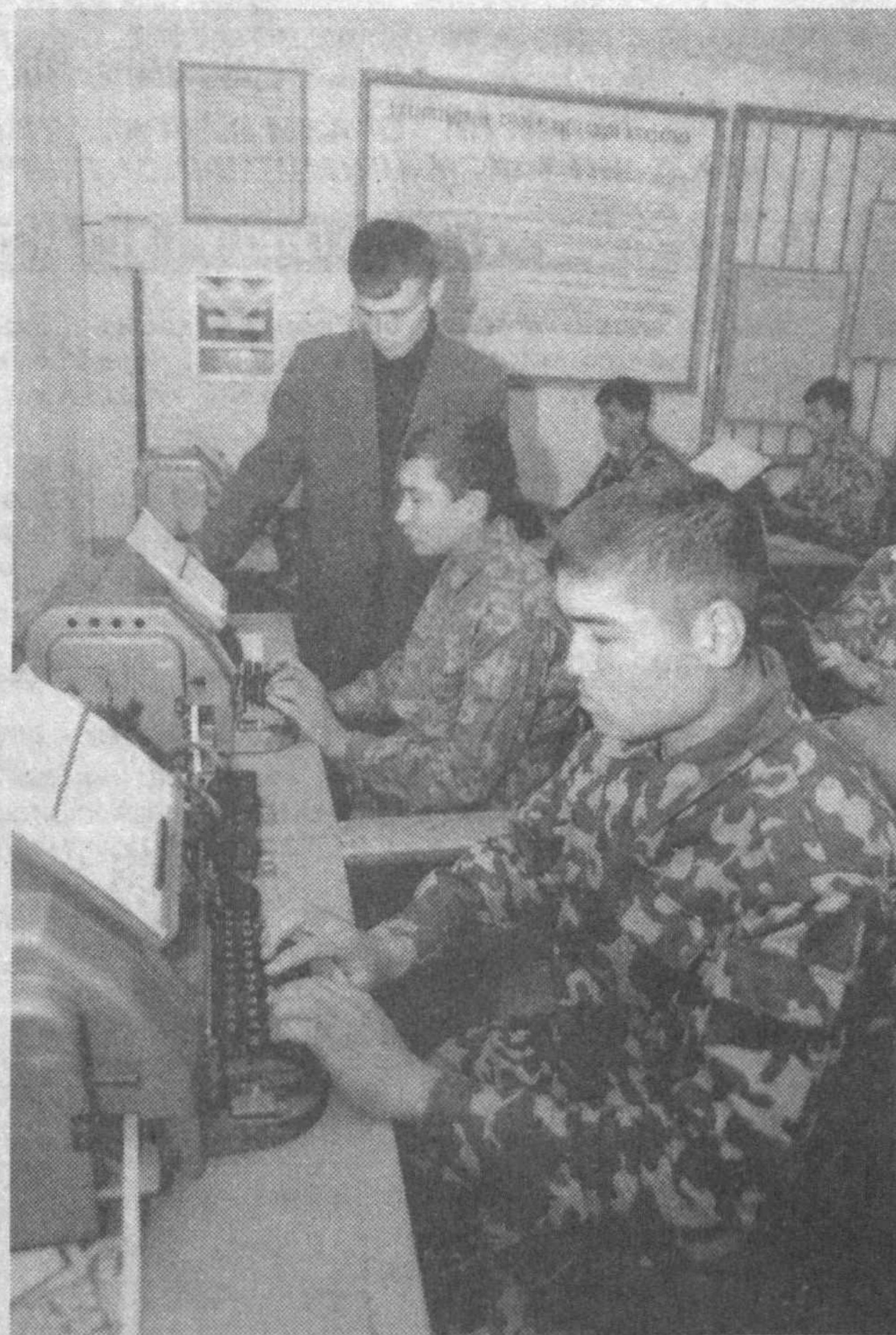
Билим ва маҳорат мактаби

сўзлар мағзини Ёқуб Чархий билан суҳбатларда чаққан, муаммога жавоб топган эди. Яъни мусулмон бўлмоқ — бу фуқаро, халқ манфаатлари учун яшамок эканлигини кашф қилган эди. Таъкидлаш жоизки, кейинроқ, яъни 1451-52 йилларда Самарқандга бутунлай кўчиб келган Хожа Аҳрор Валийнинг ҳаёт дастури ана шу таълимот асосида тузилди. У бунга қуйидагича ифодалаган эди: «Агар биз шайхликни бўйнимизга олсак эди, унда бирон-та шайх мурид топа олмасди. Аммо бизга бошқа масъулият, яъни мусулмонларни золимлар зулмидан ҳимоя қилиш ва заифаси юклатилган. Ана шунга амалга ошириш ва мусулмонлар манфаатини ҳимоя қилиш мақсадида подшоҳар билан мулоқотда бўлиб туриш, уларнинг ишончини қозониш лозим... Агар машойихлар ўз вақтларини аяб, бу ишга эътибор қилмаган бўлсалар, биз фуқаро учун вақтимизни аямаямиз».