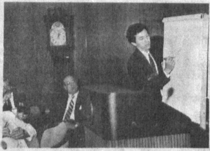
Суратда: мақола муаллифи АҚШ-даги Томас Жефферсон номида университетда маъруза қилмоқда.

ЎЗБЕКИСТОН Республикаси жаҳон ҳамжамиятига қомил ишонч билан кириб бормоқда. Давлатнинг миллий манфаатларини идрок этиш, мамлакатнинг ички ва ташқи сийсати тизимини шиллаб чиқиш жараёналари жадал сурбатларда бораётди. Одамлар Ватан истиқболни, мамлакатнинг иқтисодий салоҳиятини ва унинг жаҳон давлатлари тизимидаги ўрни ҳақида чуқурроқ ўйлайдиган бўлиб қолдилар.