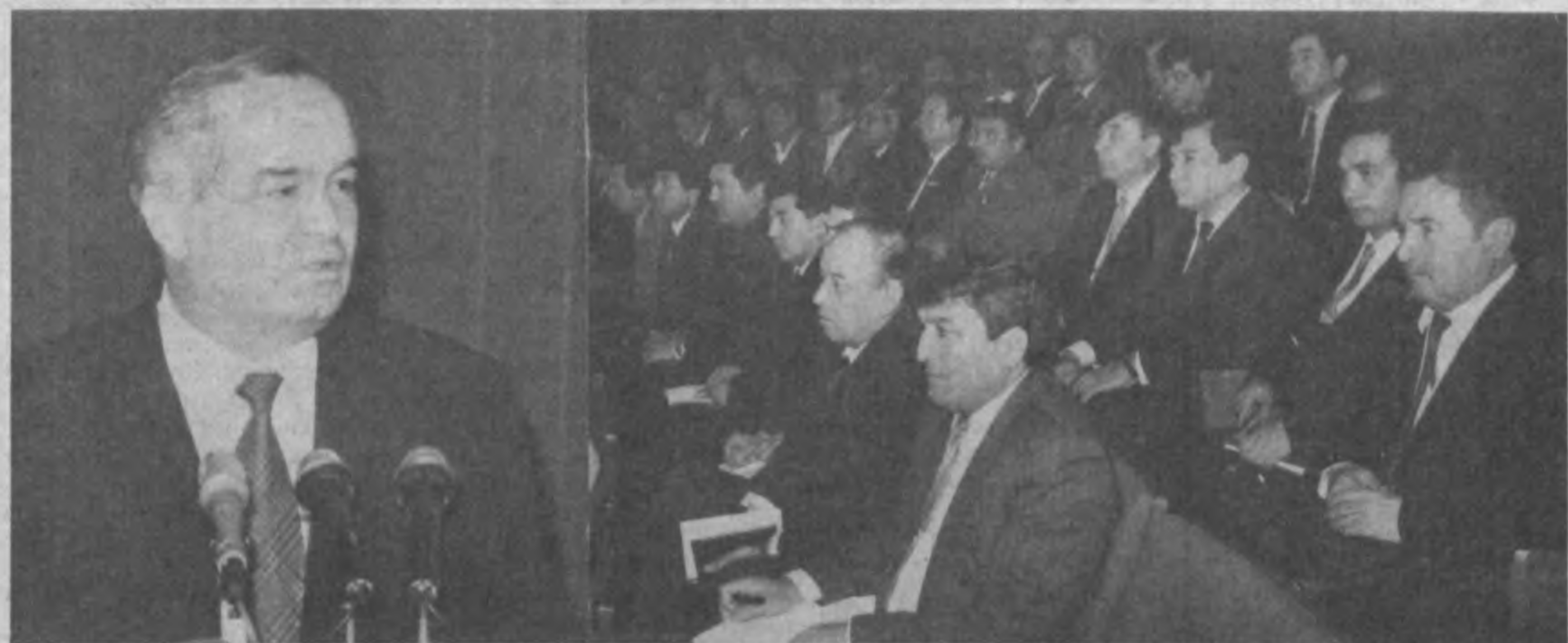
НА СНИМКАХ: во время выступления Президента республики Ислама Каримова на сессии.

4 января состоялась первая сессия Навоййского областного Совета народных депутатов. На ней выступил Президент Ислам Каримов. Президент, прежде всего, остановился на недавних выборах, проведенных впервые в республике на демократической и многопартийной основе. Затем глава нашего государства, подчеркнув важное место Навоййской области в экономике страны, выразил благодарность ее населению за самоотверженную и плодотворную работу в условиях переходного периода.