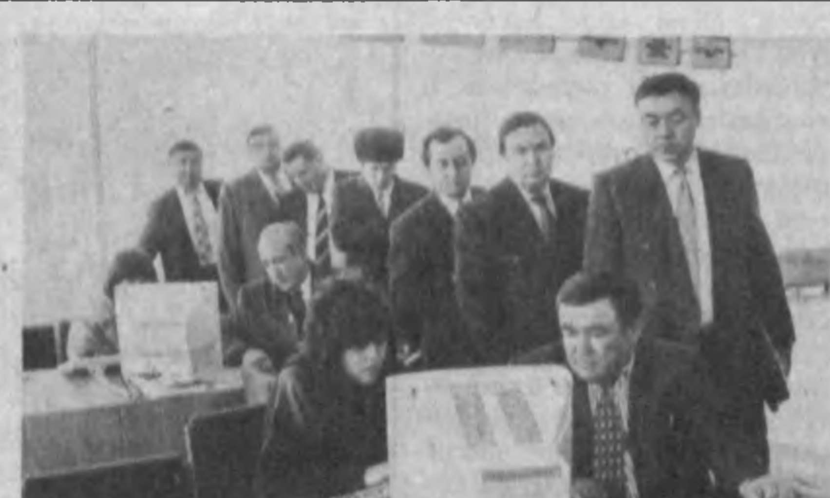
Итак, он состоялся, этот день. Парламентарии нового для нашей республики типа, получившие мандат доверия от народа и жесткой и порой бескомпромиссной борьбе, прошедшей не легкой, полной неожиданностей и сюрпризов предвыборной марафон, займут свои места в новом законодательном собрании Республики Узбекистан. Они начнут свою работу, важную и кропотливую, требующую широкого кругозора и патристичности ума, глубоких знаний и чистых помыслов, оптимизма и выносливости, мудрости и умения видеть перспективу. Они, наши депутаты — ученые и хозяйственники, юристы и бизнесмены, учителя и управленцы, словом, люди разные по профессиям, интересам, но несомненно, все они — яркие

тан и нормативных актов Центрального банка. Ликвидационная комиссия принимает претензии в течение двух месяцев со дня опубликования объявления.