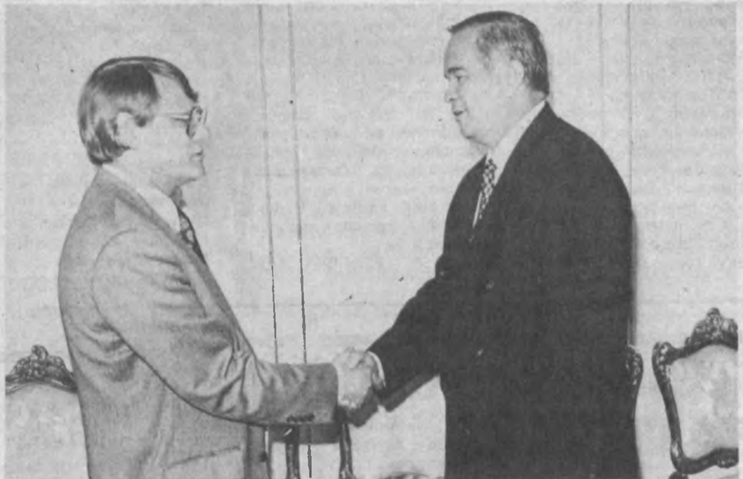
НА СНИМКЕ: во время приема.